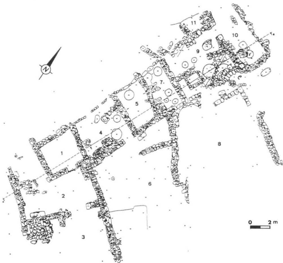
Fig. 4 – Viviendas de Navalvillar, Colmenar Viejo (Madrid) según Concepción Abad (fuente : Caballero cit. n. 34, fig. 8) y de Vilaclara, Castellfollit de Boix (Barcelona) (fuente : Enrich cit. n. 11, fig. 12).