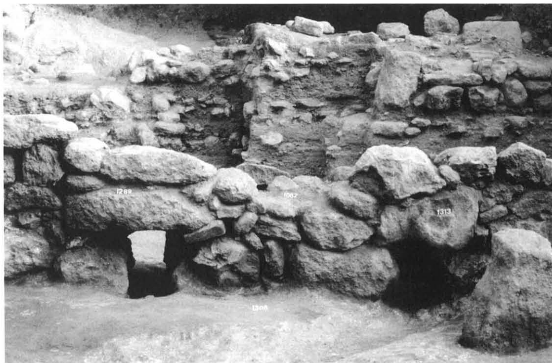
Fig. 3 – Detalle del desagüe del canal y de las atarjeas que atraviesan el muro 1062.