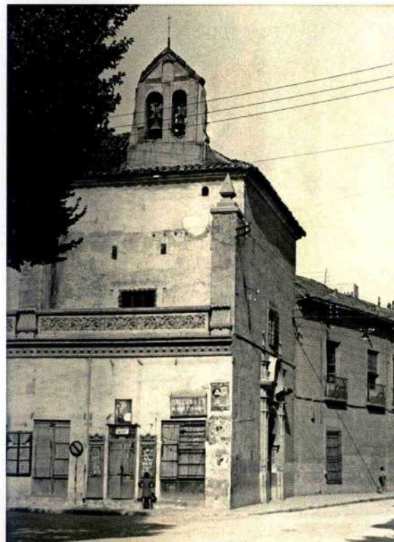
Convento de Justinianas de la Concepción (exterior), Plaza del Altozano