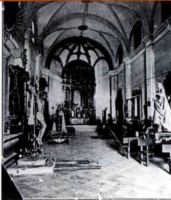
Convento de Justinianas de la Concepción (interior)