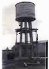
Se constituye la Sociedad de Aguas Potables de Albacete