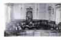
Se decora interiormente el ayuntamiento de la ciudad