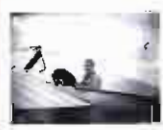
Exhibición aérea en Albacete con Leoncio Garnier