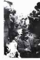
Inauguración del alcantarillado