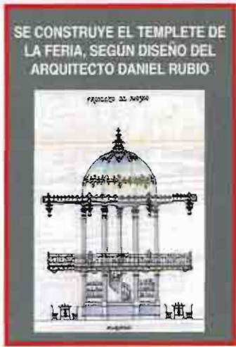
SE CONSTRUYE EL TEMPLETE DE LA FERIA, SEGÚN DISEÑO DEL ARQUITECTO DANIEL RUBIO