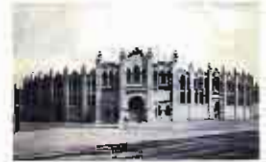
Se construye la plaza de toros: Arquitecto Julio Carrilero