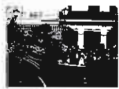
Alfonso XIII inaugura las aguas potables de la ciudad