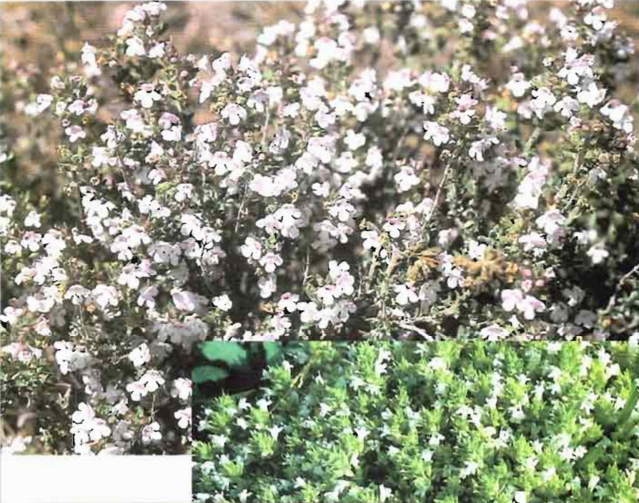
39. Thymus orospedanus Huguet del Villar