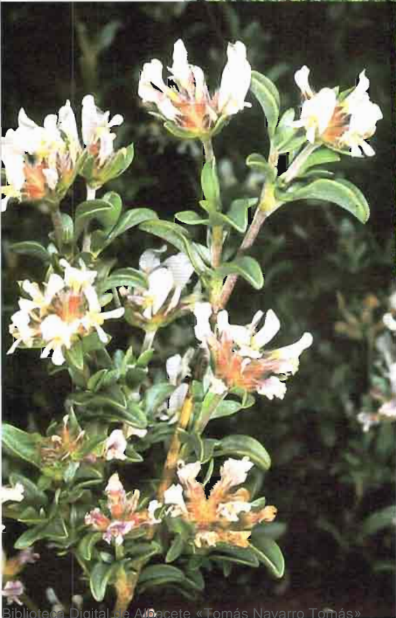
41. Anthyllis lagascana Benedi