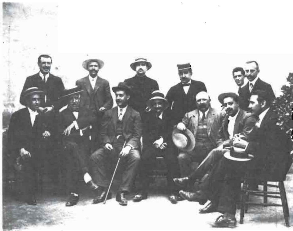
En esta fotografía, que publicó Alberto Mateos Arcángel ( Del Albacete Antiguo . Albacete, I. E. A., 1983), podemos contemplar a algunos de los periodistas albacetenses de comienzos de siglo.