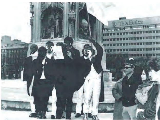
Protesta de Greenpeace.