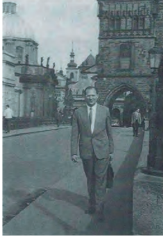
Profesor en Praga.

«Este es el punto de arranque para mi vida posterior y mi orientación política y sociológica. En mis estudios de la cátedra descubro que la clase obrera va perdiendo peso. Es decir: la predicción de Karl Marx no se cumple, en el sentido de que el capitalismo se resume en dos clases: la obrera y la burguesa. Hay una serie de clases intermedias que en el sector terciario tienen una gran influencia».