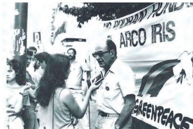
Protesta de Greenpeace.

de Al Gore consiguieran que los temas ambientales entraran en las páginas de información económica.