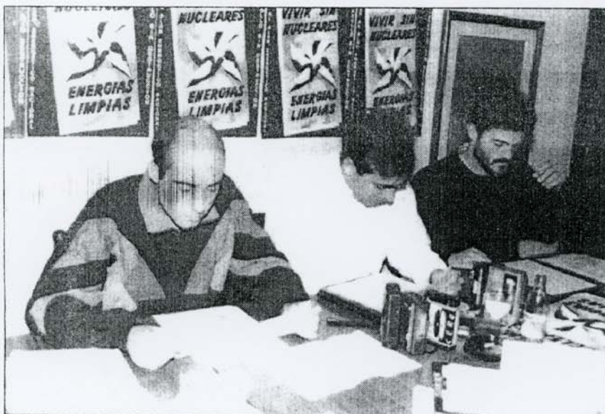
Miembros de Aedenat en la presentación de la campaña "Vivir sin nucleares".

Miembros de Aedenat expresaron que "todos los informes realizados por distintas asociaciones ecologistas, coinciden en que existe una íntima relación entre el gasto energético y el