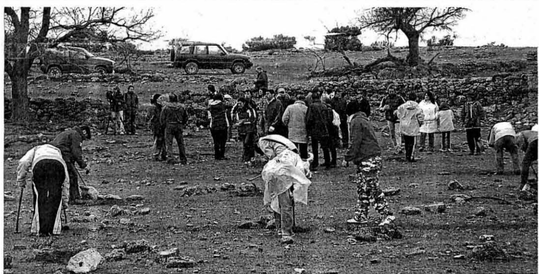
ACCIÓN SIMBÓLICA. Los participantes en la repoblación del campo de tiro plantaron 200 arbustos de tomillo, coscoja y esparto.