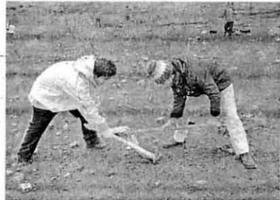
MANO A MANO. Dos jóvenes cavando. /LV