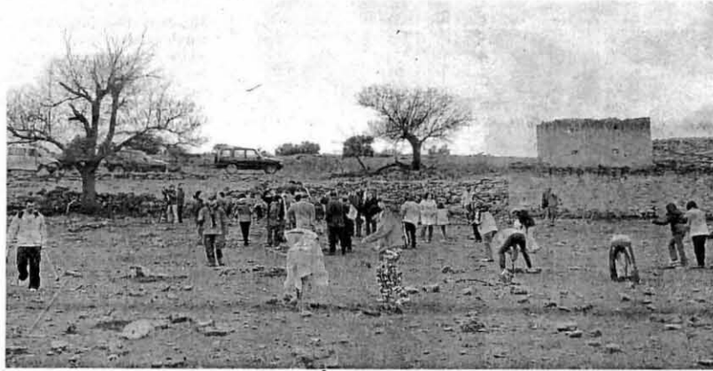
MASIVA. A pesar de la lluvia, cerca de un centenar de personas participaron en la repoblación.