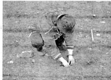
CON MIMO. Colocación final de la planta.

a sus ejércitos, incluidos los de la Otan; Albacete es la provincia más militarizada de España».