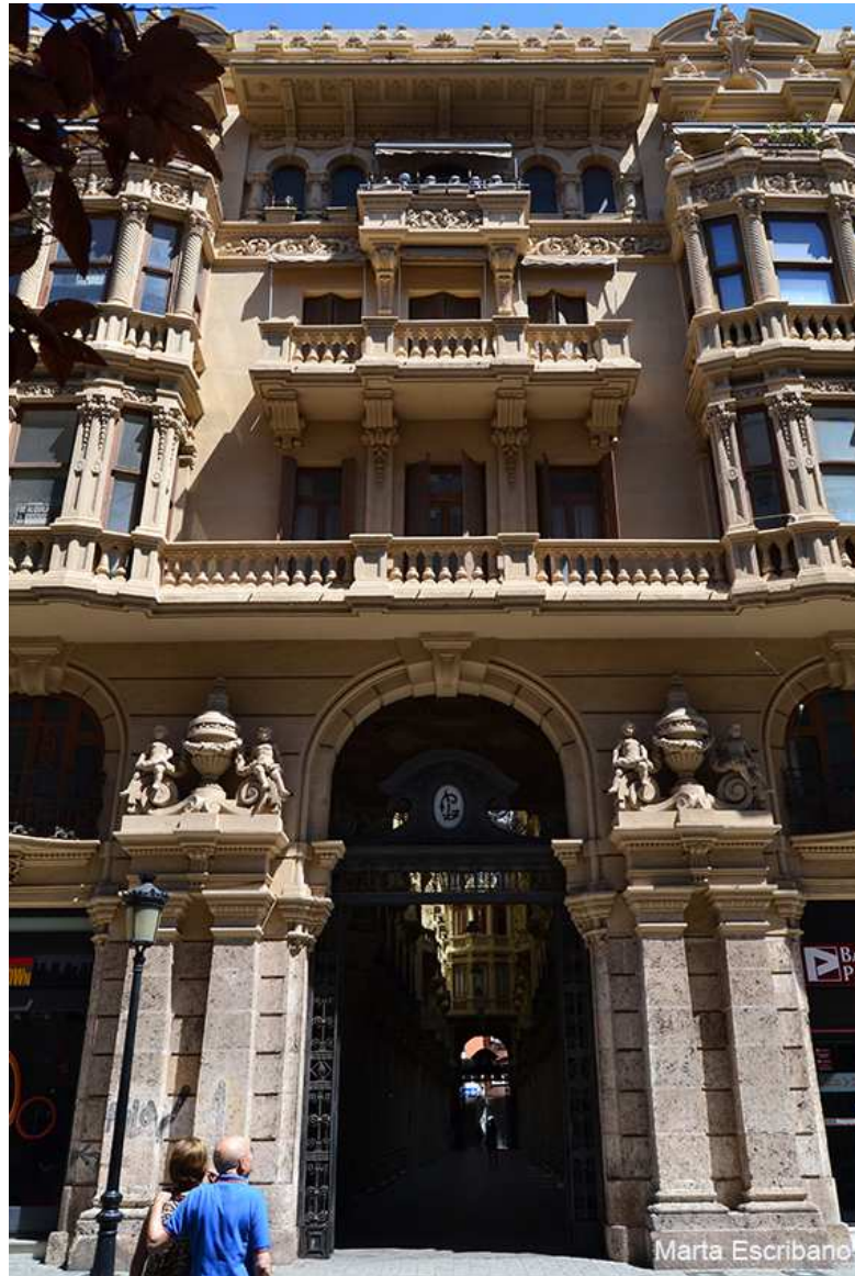
Calle Tinte