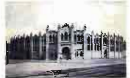
Se construye la plaza de toros: Arquitecto Julio Carrilero