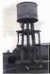
Se constituye la Sociedad de Aguas Potables de Albacete