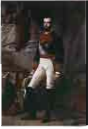
Amadeo I desembarca en Cartagena y hace escala en Albacete camino de Madrid