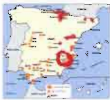
Asalto de los Carlistas con Santés