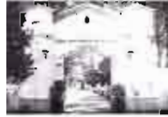
Se bendice el actual cementerio, construyéndose su capilla, quizás según proyecto de Justo Millán

SE INAUGURA EL TEATRO CIRCO CON LA ZARZUELA: "EL DIABLO EN EL PODER"