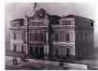
Comienzan las obras del palacio de la Diputación Provincial, según proyecto de Justo Millán