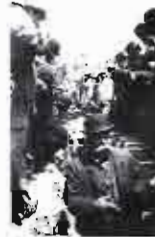
Inauguración del alcantarillado