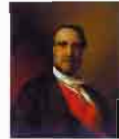
Muere el Marqués de Molins en Lequeitio (Vizcaya)