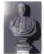
Muere el arquitecto Francisco Jareño