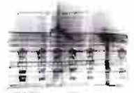
El arquitecto Peyronet hace un primer proyecto de reforma del ayuntamiento