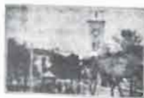
Plaza de la Constitución