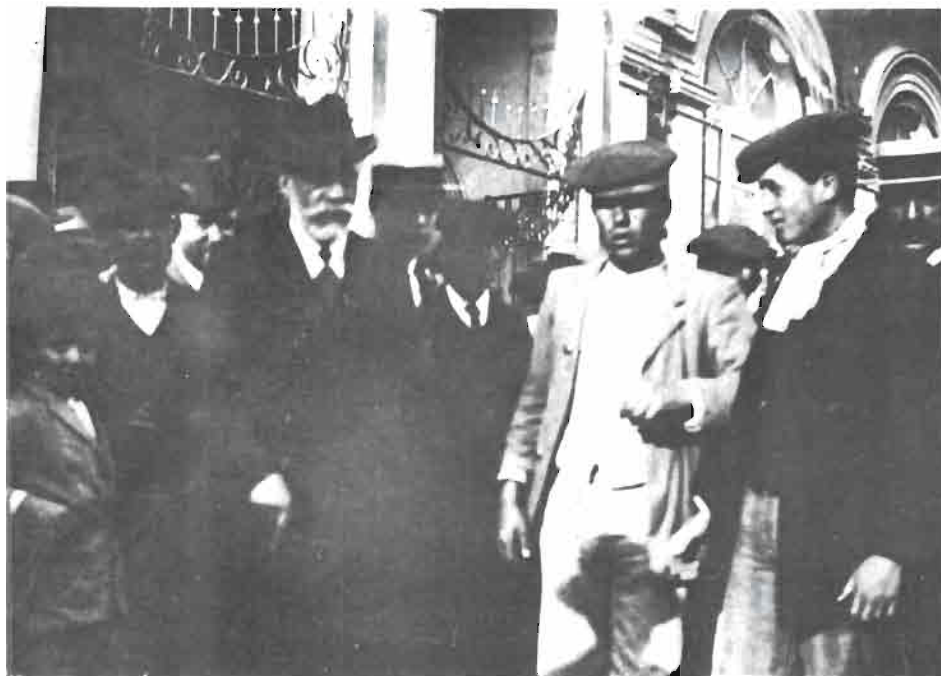
PABLO IGLESIAS EN ALBACETE (Alberto Mateos: Del Albacete Antiguo . Albacete, I. E. A., 1983). La prensa socialista estuvo presente en el estadio de la prensa local desde 1910 con El Socialista de Albacete . Después aparecieron otros periódicos de la misma ideología como El 13 , Libertad y Patria , El 13 de Albacete , Tierra o Vanguardia .