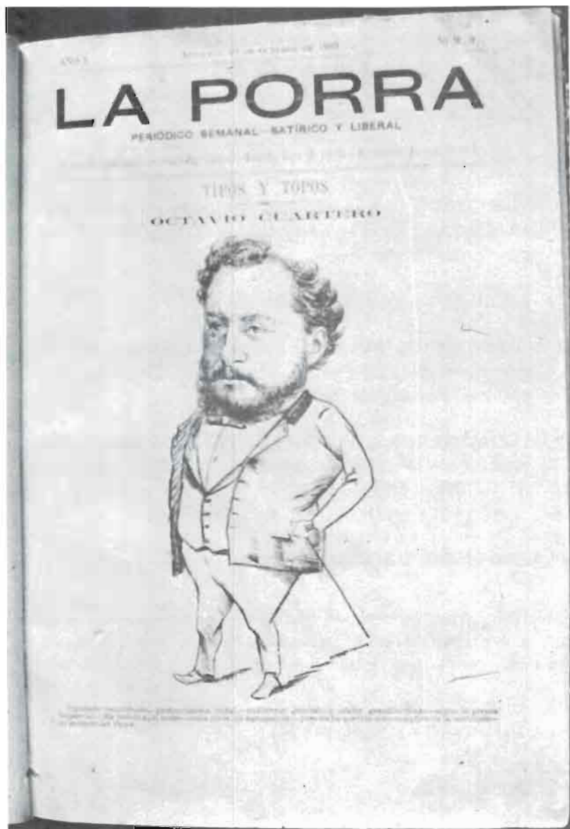
Semanario satírico que dirigió entre 1889 y 1891 José Cuartero. En sus páginas se contemplaba la vida provincial con ironía y actitud incisiva.