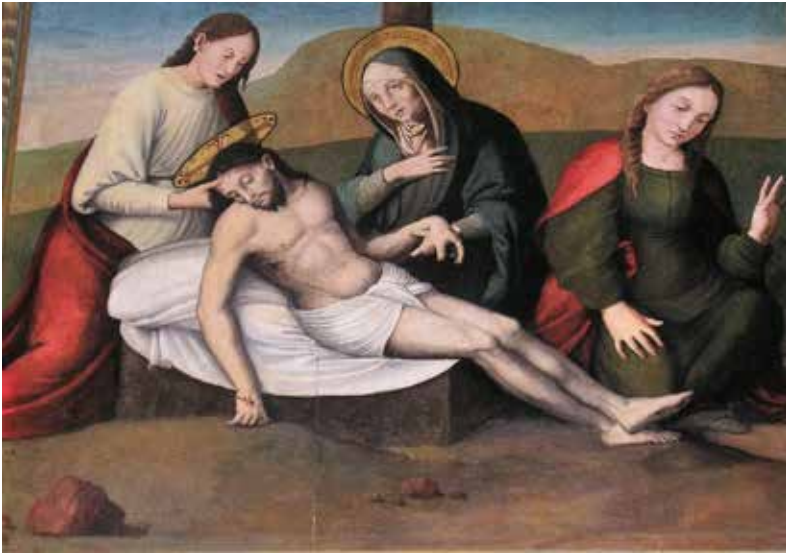
Fig. 7.- Piedad.

En la Piedad (92 x 111 cm), en un paraje crepuscular y al pie del montículo donde se advierte el arranque de la Cruz, Cristo acaba de ser descolgado de la misma. Su cuerpo inerte y con paño de pureza, con la sangre coagulada que ha manado de sus heridas, reposa sobre una sábana y una piedra. Juan, a un lado, le sujeta la cabeza. Su madre, con nimbo y toca, le coge el antebrazo con una mano y lleva la otra al pecho con gesto triste. A los pies de Cristo, María Magdalena con manto rojo iza su mano izquierda (Fig. 7).