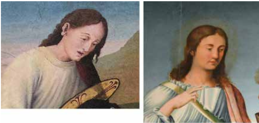
Fig.18.- Detalles de San Juan en la Piedad de Letur y en el retablo de San Juan de la Claustra (Museo de la catedral de Murcia).

Sirva de prueba para este argumento la identidad de modelos en ambas obras. Como el San Juan de la Piedad de Letur que repite el de San Juan Evangelista en el retablo del Museo de la catedral de Murcia (Fig. 18). El lóbulo alargado de la oreja del primero está concebido de la misma forma que el de San Jerónimo en la predela del conjunto murciano (Fig. 19). Los soldados dormidos, los moros muertos y los pastores de las tablas de Letur muestran el mismo flequillo corto y desaliñado que los ángeles en la Piedad de este último retablo, etc.