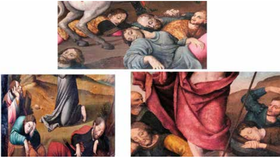
Fig.14.-Detalles de los moros vencidos en la tabla de Santiago de Letur, apóstoles de la Oración en el huerto del retablo de capilla de la Virgen de los Llanos de la catedral de Albacete y soldados de la Resurrección de Letur.

La figura de Santiago a caballo parece inspirarse en grabados de la batalla de Clavijo del alemán Martin Shongauer (1448-1491) y la repitió el Maestro de Albacete/Juan de Vitoria en el fondo de la tabla de Santiago, que se conserva en Alcaraz (Fig. 15).