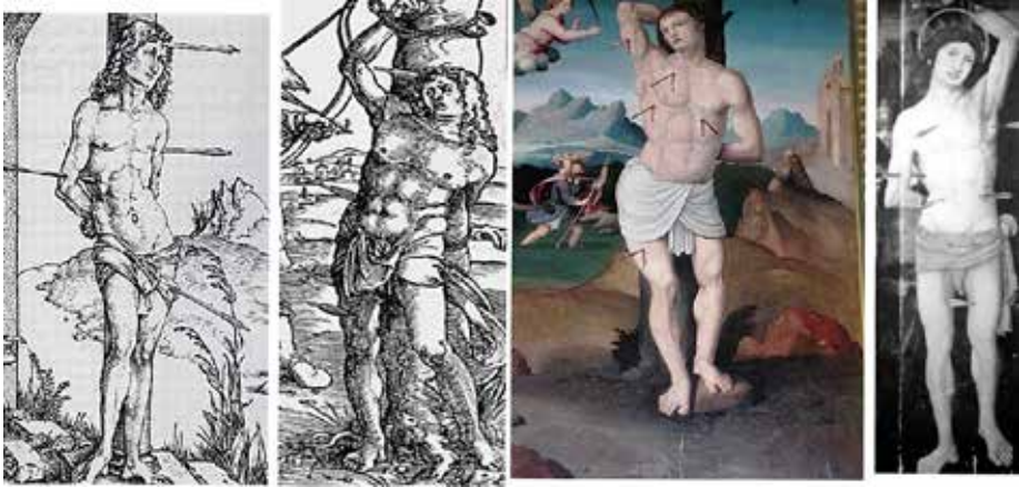
Fig.11.- Grabados de Dürero, Baldung Grien , San Sebastián de Letur y en una tabla de Miguel Esteve (detalle).

plasmar un cuerpo bello ,aunque chato, y debe estar inspirado en alguna estampa (para él italiana), evocando (posición de su brazo izquierdo) el esclavo moribundo (c. 1513) de Miguel Ángel en el Museo del Louvre 34 .