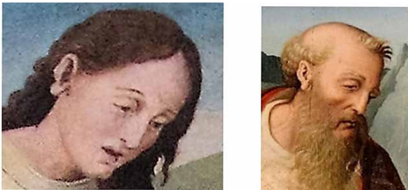
Fig.19.- Lóbulos de las orejas de San Juan en la Piedad de Letur y y en el San Jerónimo en el retablo de San Juan de la claustra (Museo de la catedral de Murcia).