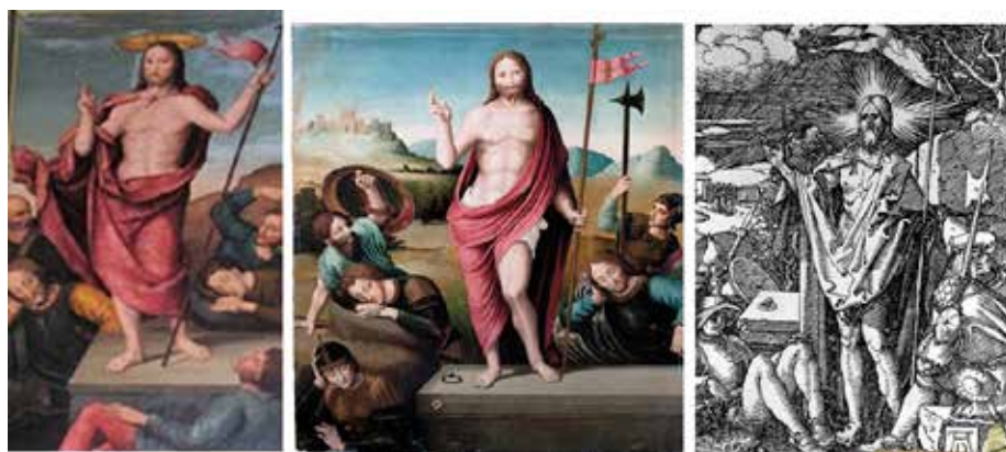
Fig.9.- Resurrección de Letur, del retablo de la Capilla de los Llanos de la catedral de Albacete y grabado de Alberto Durero.

La composición deriva de la de Hernando Llanos en uno de los paneles del retablo mayor de la catedral de Valencia y es afín al mismo asunto que nuestro pintor llevó a cabo en el retablo de la capilla de la Virgen de los Llanos de la seo de Albacete, este último más cercano a Hernando Llanos. Todas ellas tienen un claro precedente en la xilografía del mismo tema de Durero en su Pequeña Pasión (1509-1511) (Fig. 9).