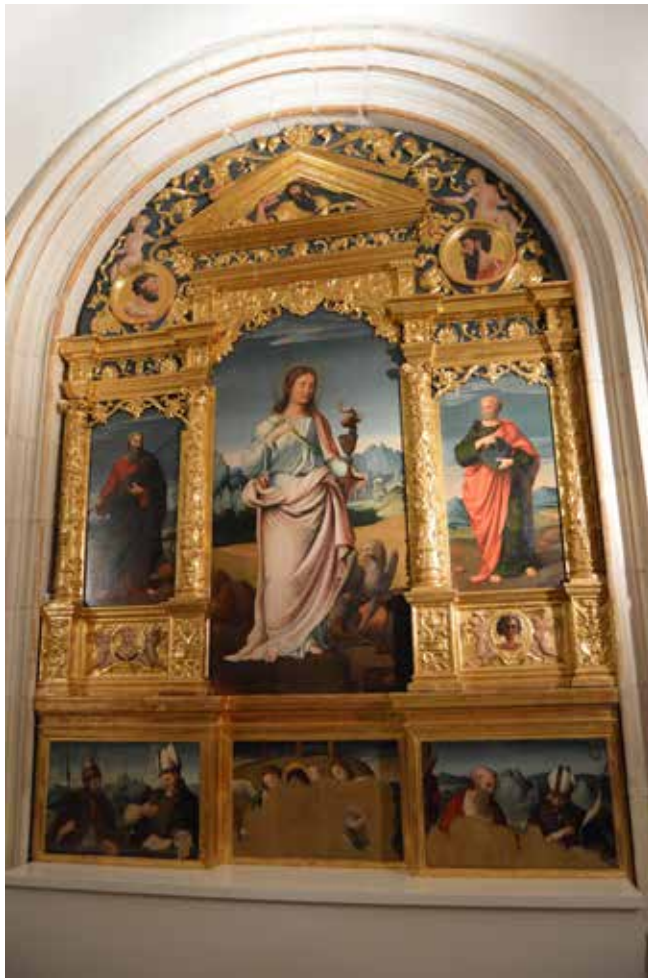
Fig.17.- Retablo de San Juan de la Clastra. Museo de la catedral de Murcia.

En las obras del Maestro de Albacete ( y especialmente en las de la parroquial de Letur), sus composiciones, tipos humanos y fondos de paisaje, guardan muy estrechas relaciones con el único trabajo conservado y al parecer documentado de Andrés de Llanos, el hermano menor de Hernando Llanos: el retablo de San Juan de la Clastra de la catedral de Murcia, que se pintaría en 1545 (Fig. 17).