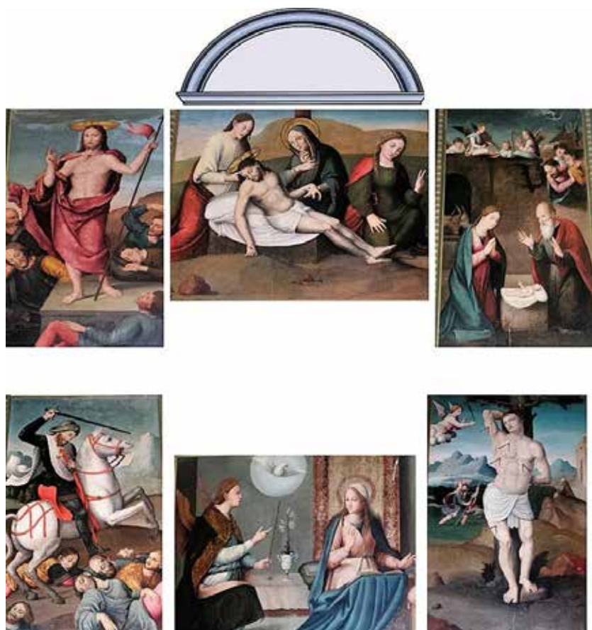
Fig.2.- Disposición original de las tablas en el antiguo retablo mayor.

En tiempos de Amador de los Ríos se conservaba también en la iglesia un “sencillo y elegante retablo plateresco primitivo” –al parecer en la Capilla de la Inmaculada–, de líneas clásicas y frontón triangular, con una sola hornacina en el centro. En el friso del entablamento, en capitales latinas de oro, se leía: LUCIA SPONSA CHRISTI 21 . Por lo que hay que deducir que estaba dedicado a Santa Lucía, aunque en ese momento mostraba una de esas industriales esculturas modernas, según palabras del mencionado investigador, de la Inmaculada Concepción.