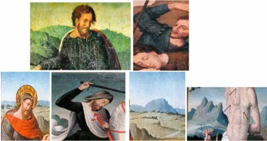
Fig. 16.- Detalle personaje en la tabla de la Traslación del cuerpo de Santiago (MUBAM) y soldado de la Resurrección de Letur. Detalle del rostro de Santiago en la Predicación de Santiago (MUBAM) y el Santiago matamoros de Letur. Paisaje en la Predicación de Santiago y en el San Sebastián de Letur.

Como hemos advertido algunas de las composiciones de las tablas de Letur están basadas en grabados, en ocasiones combinando detalles de unos y otros. La dependencia de los Hernando, Yáñez y Llanos, se mitiga, quizá porque las obras que comentamos están ya lejanas en el tiempo a la producción de estos pintores.