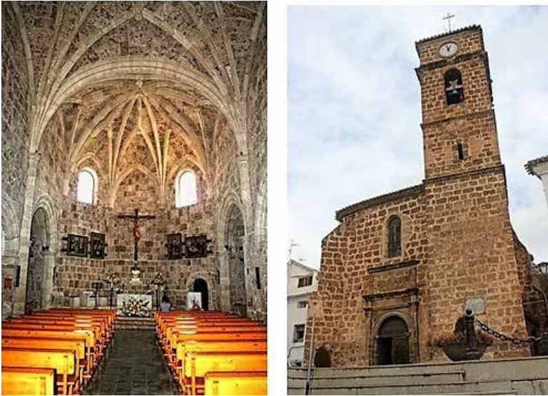
Fig.1 Iglesia parroquial de la Asunción de Letur (cabecera y exterior del edificio).

Así describe Javier Pérez Tomás su portada principal: es renacentista plateresca, formada por un arco de medio punto entre dos pilastras con capitel corintio, y en las enjutas motivos florales. A continuación, una primera cornisa y encima el friso, con frutos y hojas y la inscripción ETA OBRA SE FIZO EN EL ANO DE MDXXVIII (“Esta obra se hizo en el año de 1528”). Sobre la segunda cornisa, un espacio a modo de ático, enmarcado por dos flameros abalaustrados, donde aparecen las iniciales de Jesús a la izquierda “IHS” y de María a la derecha “MA”. En el centro y entre dos cuernos de la abundancia, un escudo rematado por una cesta de frutas, en cuyo interior aparece un jarrón con azucenas, en clara alusión a María. Encima de la portada una amplia ventana abierta a principios del S. XX sustituyendo al ojo de buey o vano circular que había 17 (Fig. 1).