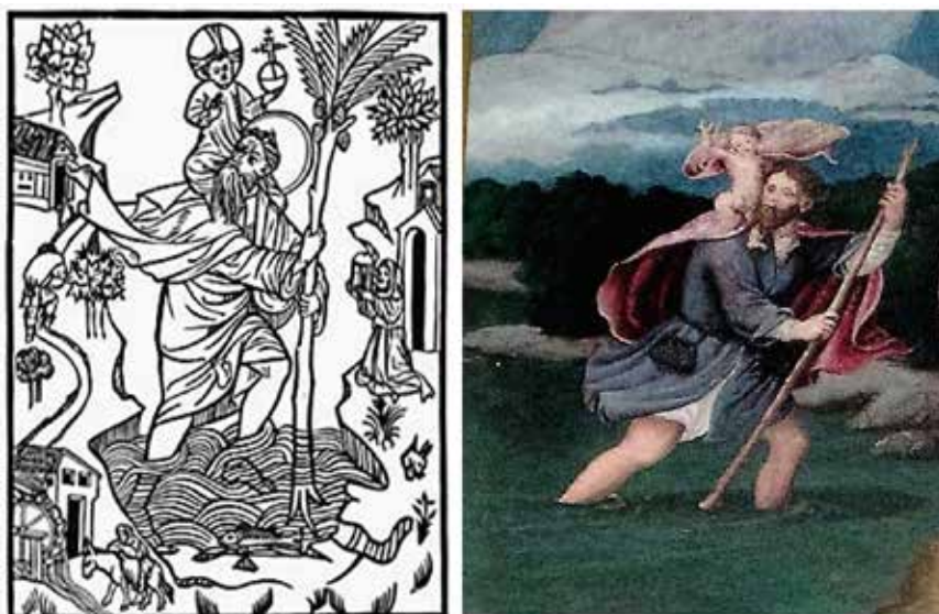
Fig.12.- San Cristóbal de Buxheim y en la tabla de San Sebastián de Letur.

Santiago matamoros (116 x 74 cm), con armadura, sobre su caballo blanco enjaezado y en corveta, arremete con espada larga contra los sarracenos, caídos por tierra, yacentes y muertos, con gotas de sangre en sus cabezas, salvo el que está vivo que es observado por el apóstol para ser rematado, tal como apareció en la batalla de Clavijo (año 844). Lleva estampada sobre su capa blanca la Cruz de Santiago, emblema de la Orden; una cruz de gules simulando una espada con forma de flor de lis en la empuñadura y en los brazos. Contrastan el negro del sayo y el rojo de la montura. En su gorro se advierte la concha de peregrino, en referencia a las peregrinaciones del denominado Camino de Santiago a la tumba del apóstol, descubierta poco antes, en el 813 (Fig. 13). Los moros vencidos evocan los apóstoles de la Oración en el huerto y los soldados dormidos de la Resurrección del retablo de la capilla de la Virgen de los Llanos en la catedral de Albacete 35 (Fig. 14). Son idénticos a los sayones derribados en la escena del martirio con la rueda en el retablo de Santa Catalina de la catedral de Orihuela.