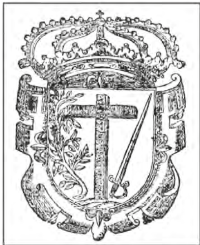
Escudo de la Inquisición.

principio quedaba sujeta a la autoridad del Tribunal, aunque su jurisdicción se extendiera más tarde a otras áreas.