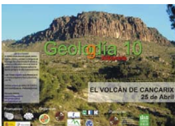
Cartel del Geolodía celebrado en 2010

Para el 6 de mayo está prevista la celebración del Geolodía 2012. Como en otras ediciones, consiste en un conjunto de excursiones gratuitas, guiadas por geólogos y abierta a todo tipo de público, sean cuales sean sus conocimientos de Geología. Está previsto que se celebre en la falla de Socovos, el día 6 de mayo. Promueven: SGE (Sociedad Geológica de España), AEPECT (Sociedad Española para la Enseñanza de las Ciencias de la Tierra) y el IGME (Instituto Geológico y Minero de España). Organizan: Universidad de Jaén (Departamento de Geología), IEA "Don Juan Manuel" de la Excm. Diputación de Albacete y el Organismo Autónomo de Espacios Naturales de Castilla-La Mancha. El IEA editará los folletos explicativos de la excursión.