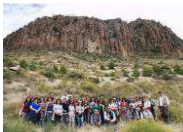
El volcán de Cancarix con el grupo participante en la excursión geológica

todo tipo de públicos sean cuales sean sus conocimientos previos de geología. Actualmente se celebra en todas las provincias españolas.