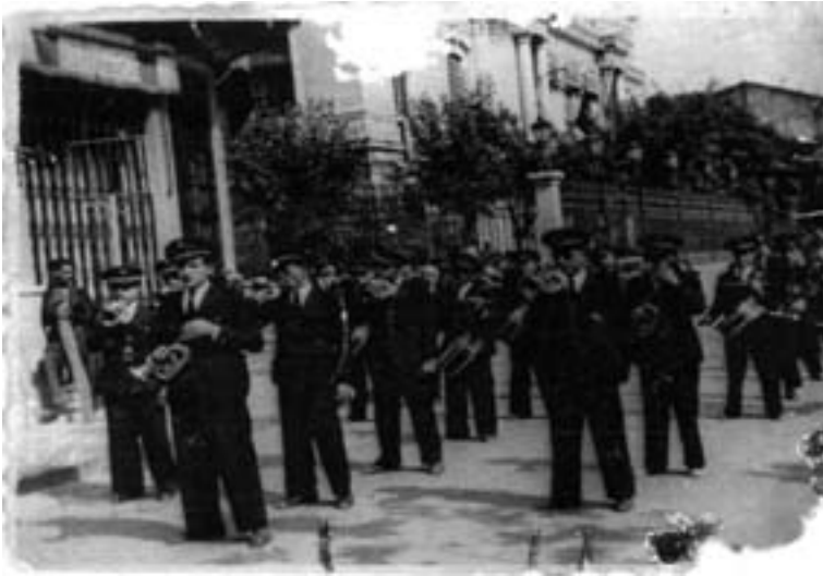
La Banda Municipal de Hellín, con la sección de Cornetas y Tambores en primer plano. Feria de Albacete de 1952.

a partir de 1950 924 . El Sábado de Pascua de 1951 tuvo lugar un concierto benéfico a cargo de la Orquesta de Cámara de Madrid 925 .