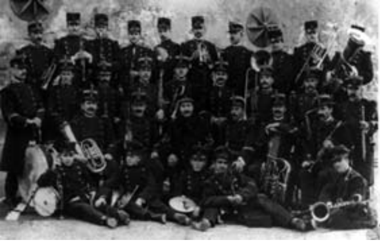
Banda de Música de Infantería de Marina, Cartagena, c. 1912.