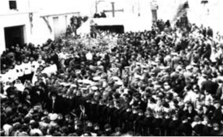
Coronación de la Inmaculada Concepción en la plaza del Convento de los Franciscanos, 6 de junio de 1954.

En Semana Santa, la Banda Municipal continuó recibiendo las gratificaciones extraordinarias por desfilas en procesión con diferentes hermandades 957 o simplemente por participar en las exhibiciones de grupos musicales en la mañana del Domingo de Resurrección, puestas en marcha a partir de los últimos años 40, para lo cual también se reforzó con músicos contratados 958 .