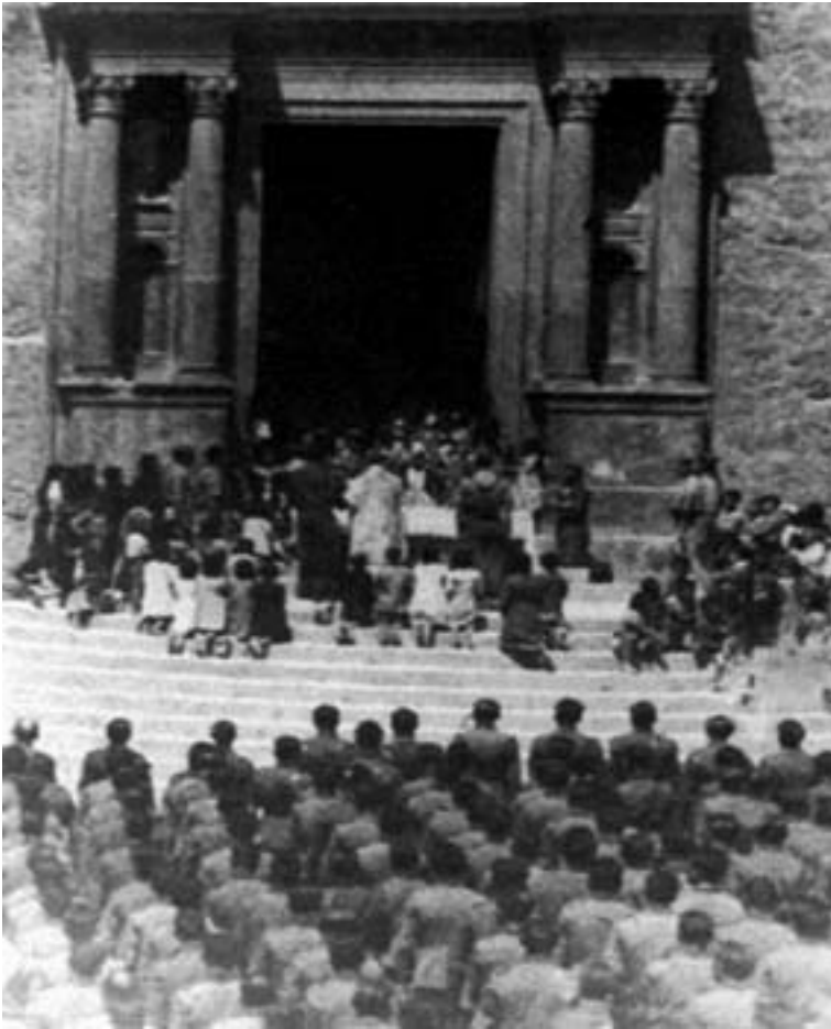
Misa de campaña con asistencia del Tercio San Miguel de la 5ª División de Navarra. Plaza de la Iglesia, 1 de mayo de 1939.

La Semana Santa de 1940 se celebró con cierta generosidad. Coincidió con la llegada de la nueva imagen de la Dolorosa 789 , desfiló por las calles una sección de caballería de Falange –no sabemos si con banda de música 790 –, se engalanó el pueblo y se anunció convenientemente 791 .