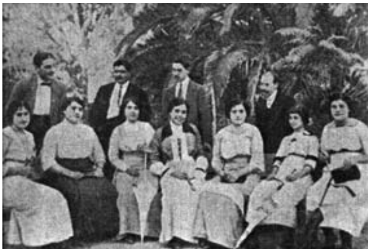
Escena habitual en el jardín de la Glorieta, a principios del siglo XX.