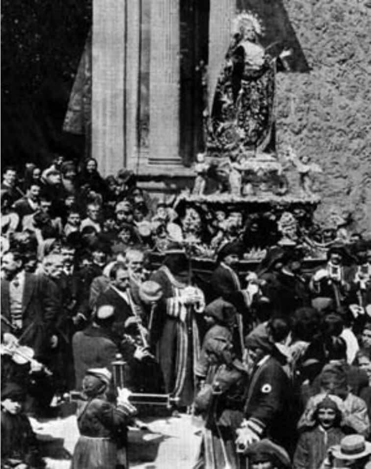
Alrededor de 1914. Violín, dos clarinetes y flauta travesera.