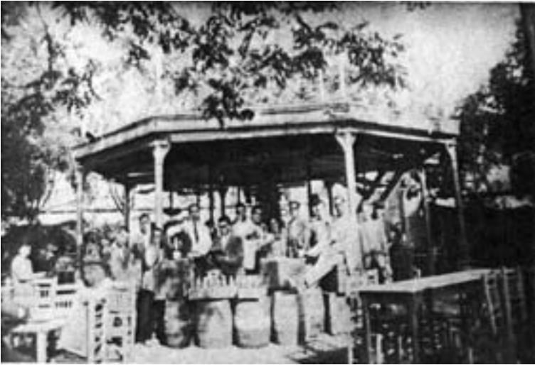
Imagen del “café–restaurant” ubicado en la parte baja del templete de la música en el Jardín–Feria en los años 1920.

explotación del establecimiento hostelero será un revulsivo para organizar la Banda ahora y posteriormente.