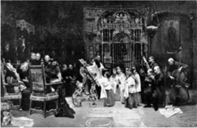
Imagen de una función de Capilla, con los músicos y los infantillos, a finales del siglo XIX. (“Los niños del coro”, lienzo de José Gallegos y Arnosa (1857–1917))

muchos años en Hellín aunque de manera intermitente, y desempeñando muchas tareas. (Véase II.2).