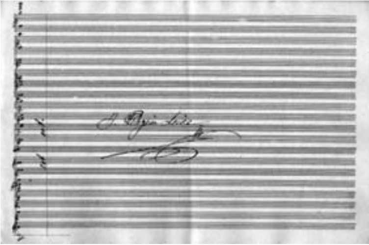
Orquestación de J.-P. Leive Márquez (3)