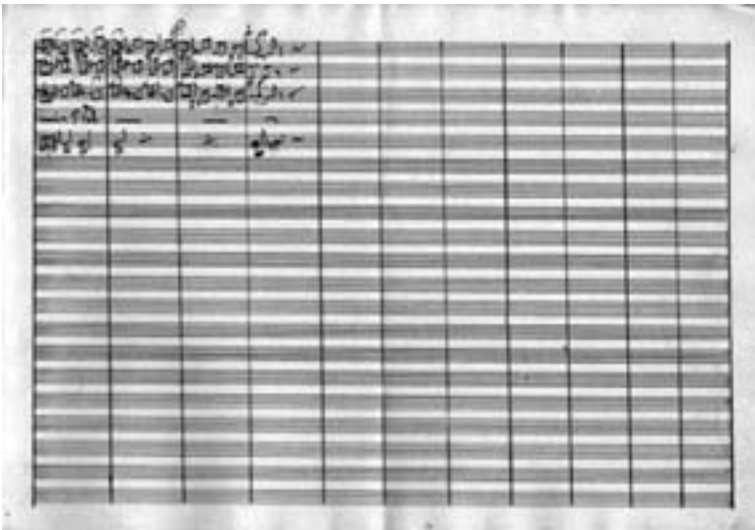
Orquestación de Apolonio San Nicolás (3)