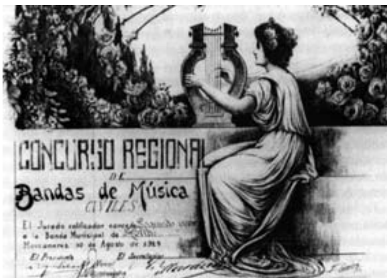
Diploma acreditativo del galardón obtenido en Manzanares. Original conservado en la actual Academia de la Unión Musical Santa Cecilia de Hellín.

después 692 , con lo que suponemos que se acabaría la discusión. El caso es que, después de mucho tiempo, la Banda Municipal de Hellín dio una gran alegría a sus fieles seguidores, y al pueblo en general que vibró con ellos y compartió los laureles del triunfo, ya que aunque se trataba de un segundo premio, se celebró como si hubieran sido los vencedores absolutos 693 .