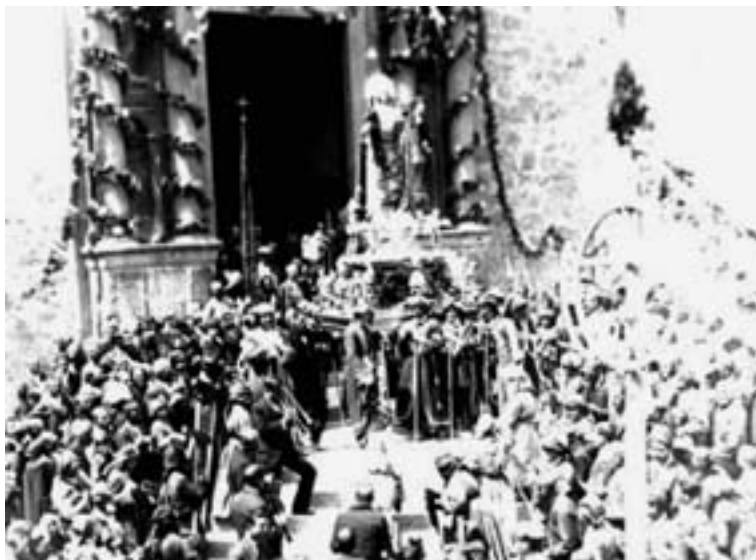
Imagen de la llegada de procesión en los años 1920, con la fachada de la iglesia ornamentada. Se pueden ver un trombón y un clarinete, así como otros músicos.