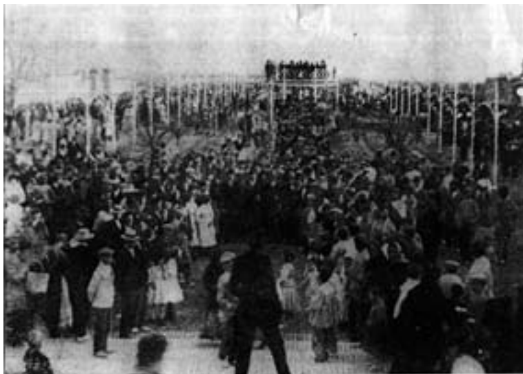
Inauguración del nuevo Jardín-Feria, con la Banda de Música ubicada en el templete central.1911.

El Jardín Feria tenía en el centro un templete o “tinglado para la música” 532 instalado el mismo año de su inauguración que en su parte inferior tenía un espacio destinado a café–restaurante. El Ayuntamiento sacó a subasta pública su explotación, comprometiéndose a que la Banda Municipal actuase regularmente o, en su defecto, que hubiera una rebaja en el precio del remate 533 , cosa que querían evitar a toda costa. La