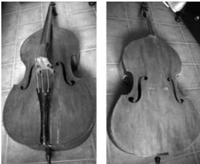
Contrabajos de tres cuerdas de la colección de Antonio Arcas Iniesta, utilizados en la Capilla de la Asunción. ( Propiedad de sus herederos )