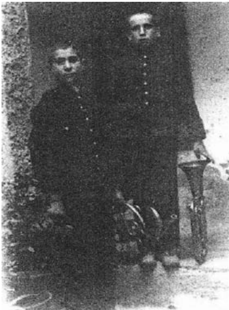
Dos jóvenes músicos de Hellín ataviados con los nuevos uniformes de 1889, sujetando una trompa y un bombardino.