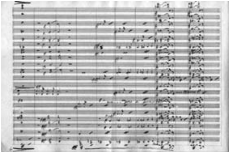
Orquestación de J.-P. Leive Márquez (2)