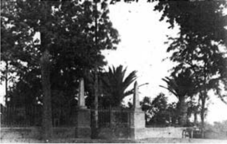
Entrada del jardín de la Glorieta a principios del siglo XX.