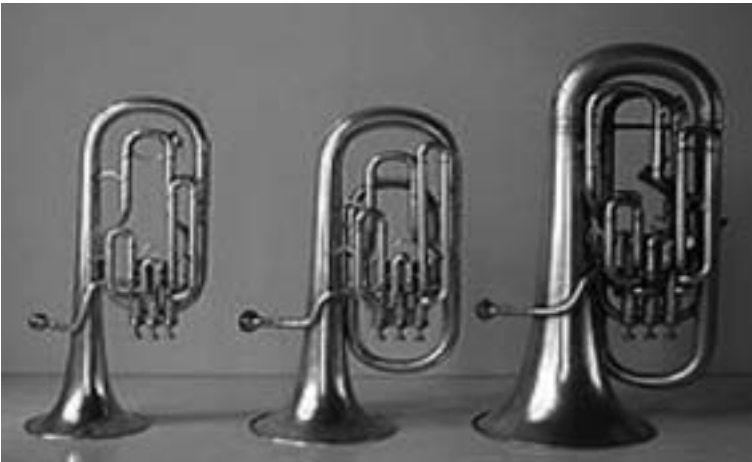
Alto trompa, bombardino barítono y bombardino.