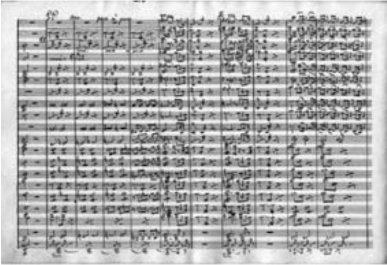
Orquestación de Apolonio San Nicolás (2)