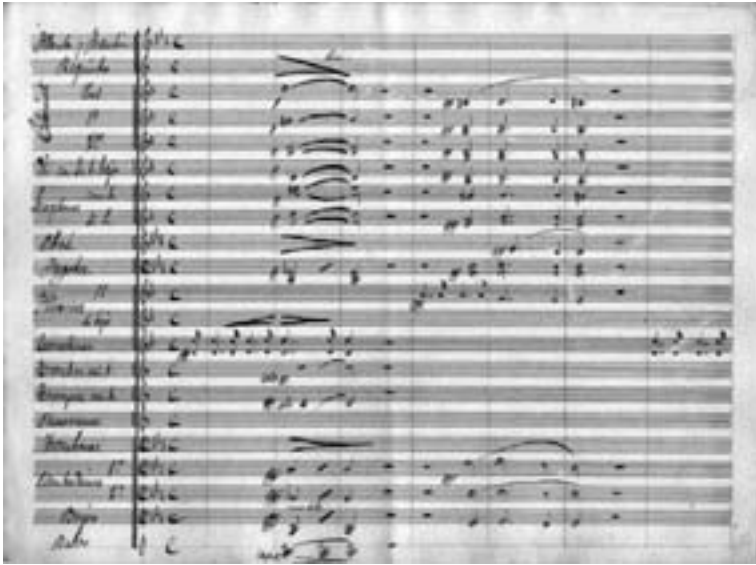
Orquestación de J.-P. Leive Márquez (1)