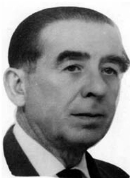
Leocadio Parras Collados, (Hellín, 1907–Madrid, 1973).