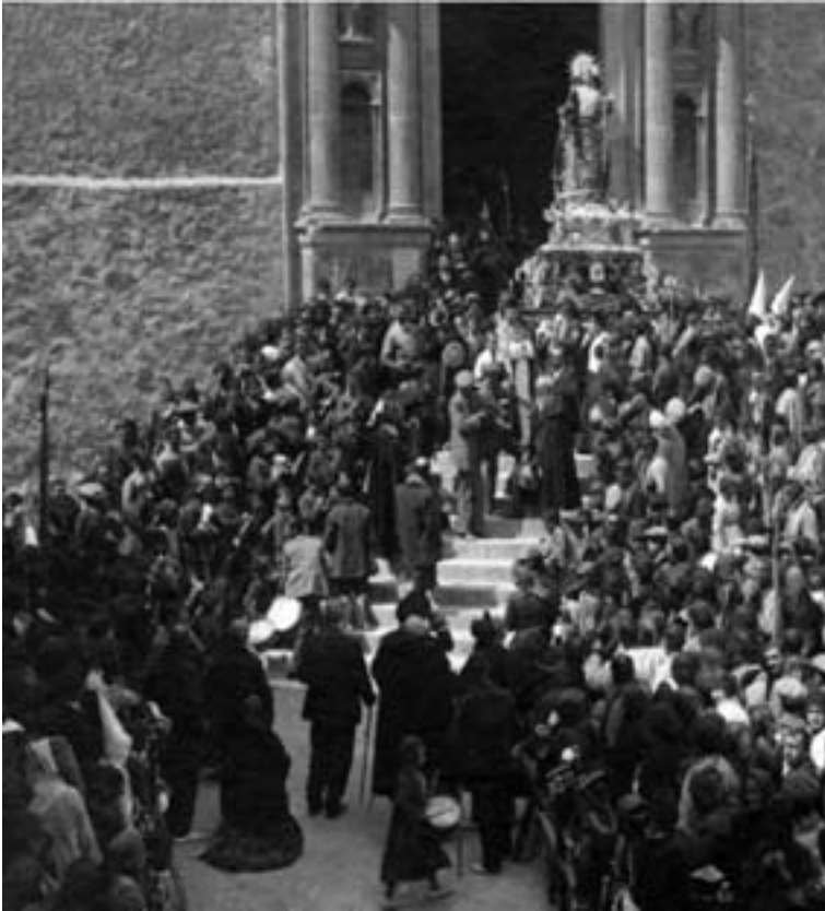
Viernes Santo de 1915. Tres violines, bombardino, clarinetes (en si b y bajo) y flauta travesera.