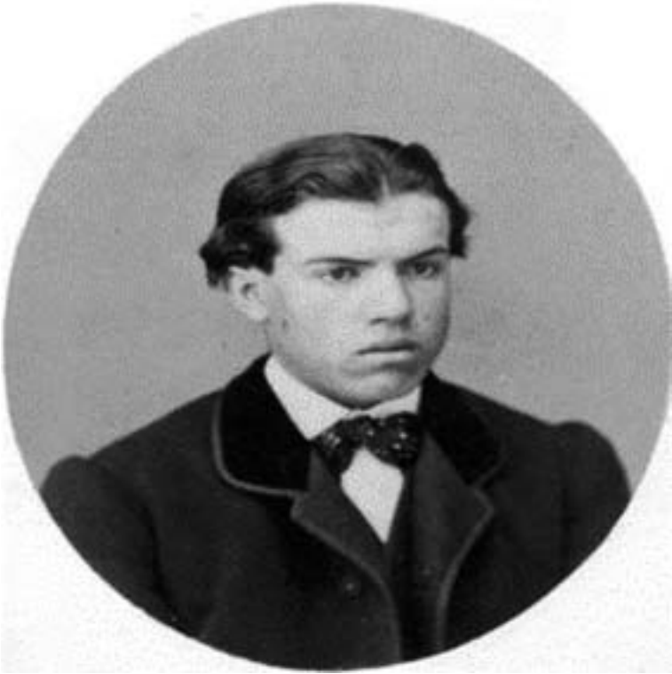
Antonio Mateos Negrillo (1857–1925).