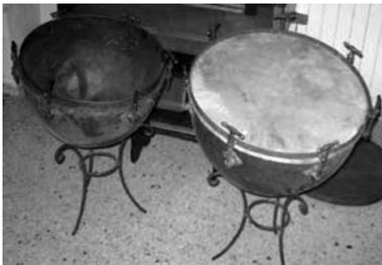
Los timbales adquiridos en 1948

nuevos instrumentos, como siempre con la previa consulta y petición de presupuesto a varias casas de música, muy parecida a la elaborada un año antes y con el mismo espíritu de superación, el deseo de disponer de lo mejor que hubiera en el mercado y con el apoyo que siempre tuvo del Ayuntamiento, la Banda consiguió un nuevo clarinete “Couesnon” y un saxofón tenor “Cleyton” 899 , además de la reparación exhaustiva de otros cuatro clarinetes 900 .