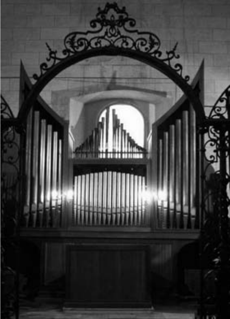
El órgano actual de la Parroquia de la Asunción de Hellín.

del puramente estético–, que cumplió la música en el interior de todos templos españoles durante tanto tiempo.