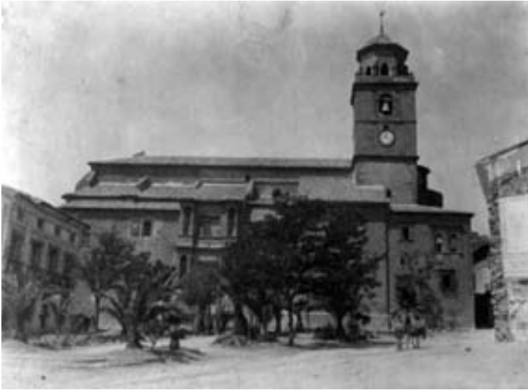
Parroquia de la Asunción. Hellín, c. 1915.

y función de san Rafael” 166 , y aunque no especifica cómo se distribuye el dinero, sabemos que había varios días de función, sermón (algunas veces se cobra aparte), procesión y festejos varios, en los que aparece indistintamente con la Banda, suponiendo que las funciones interiores estarían a cargo de la Capilla y las actuaciones al aire libre estarían realizadas por la Banda.