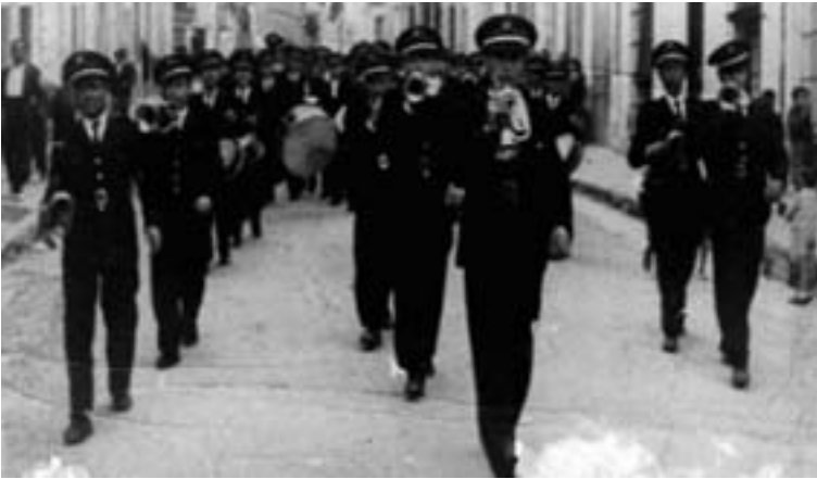
La Banda Municipal en la Feria de 1943, a su paso por la calle Juan Francisco Parras, con los nuevos uniformes azules.

solistas, 9 de primera, 9 de segunda, 10 de tercera y la sección de Cornetas y Tambores, –que ya era una seña de identidad de la Banda– con 7 cornetas y 6 tambores (cabos incluidos), pero ésta no correspondía exactamente con la plantilla real, que fue siempre algo más reducida. De esta manera era una institución municipal con músicos funcionarios a los que había que tener continuamente controlados con las inscripciones de altas y bajas de su trabajo en las academias y en los conciertos, tarea que estaba encomendada al director.