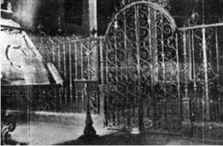
Única fotografía conservada del coro anterior a 1936, en la que se puede apreciar un fascistol y un atril así como la puerta cerrada y el arranque de la crujiá. (Revista "Centauro", Albacete, 6-12-1924)

Sin embargo esta ubicación no era la original, ya que cuando se construyó el órgano, en lugar del coro actual había una puerta al exterior 44 , y el coro estaba en medio de la nave principal, más próximo al Altar Mayor, y en un determinado momento se trasladó a su actual localización 45 .