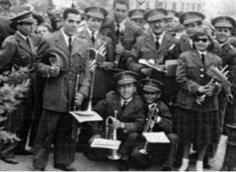
Grupo de músicos de la banda, el día 10 de abril de 1955, con los nuevos uniformes grises, en el que aparece una mujer con falda, única referencia gráfica que tenemos de ello.

En vista de los grandes acontecimientos que se avecinaban y dada la cierta antigüedad de los uniformes de la Banda Municipal, el Ayuntamiento decidió cambiarlos por otros de tela gris con adornos dorados en la primavera de 1954 977 . Los 50 nuevos uniformes se confeccionaron en la sastrería Ortín de Valencia, con género de gabardina del nuevo color, comprado en Béjar (Salamanca) 978 .