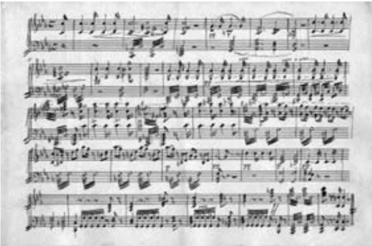
Original de piano