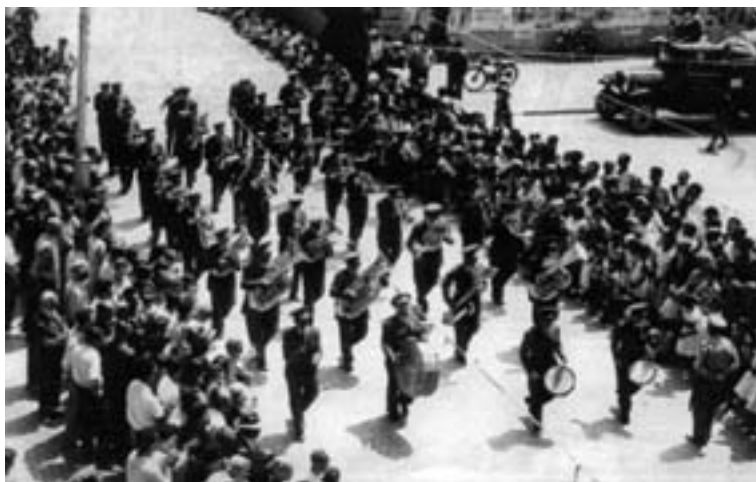
La Banda Municipal desfilando en Alicante, con motivo de las Hogueras de San Juan, el 24 de junio de 1959.

como sucedió en julio de 1960 con ocasión de actos de inauguración en la pedanía de Isso 1032 .