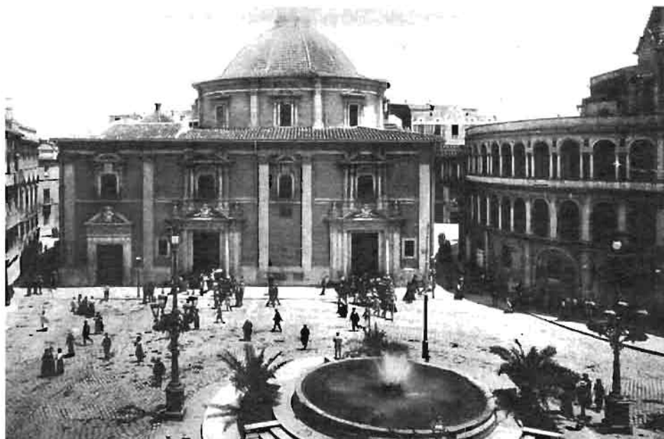
Foto antigua de Valencia donde residió nuestro paisano.