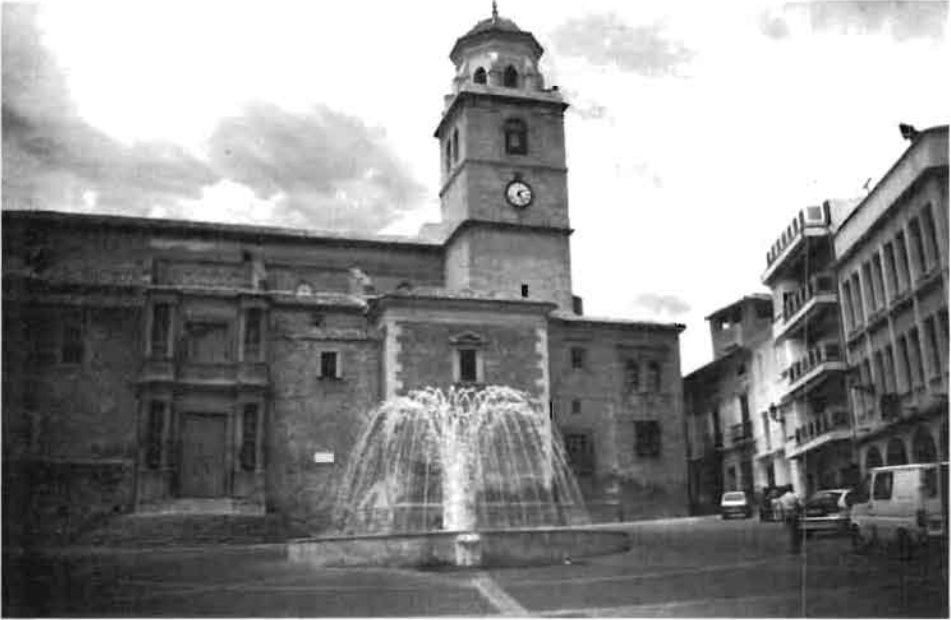
Parroquia de Nuestra Señora de la Asunción donde fue bautizado don Cristóbal Lozano.