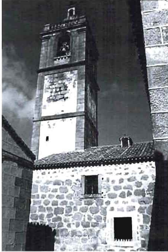
Iglesia de San Salvador , de Lagartera.

por estas fechas cuando fue nombrado “Promotor o Procurador Fiscal de la Reverenda Cámara Apostólica en el Obispado de Murcia”, ciudad que vería a nuestro autor planear y escribir la mayor parte de la Trilogía que más fama le dio: David perseguido , David penitente y El Gran Hijo de David más perseguido . Estas obras tuvieron un éxito rotundo: cinco ediciones, dos ediciones en el siglo XVII y seis en el siglo XVIII y cuatro impresiones, respectivamente.