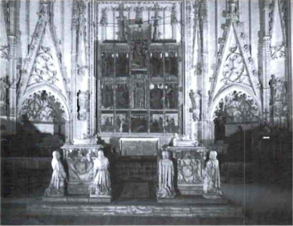
Capilla de los Reyes Nuevos de Toledo.