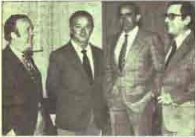
La empresa de Albacete ha dado el de pecho. Las corrientes de este año han gustado a todos. En la foto, los orificios del abono, "Comaró", "Pascués" y "El Gallo", con nuestro director.

Las máximas figuras del toreo actuarán dos tardes cada una