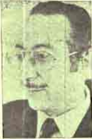
Ramón Bello Buñón

Como alcalde de Albacete supo ganar respeto y admiración