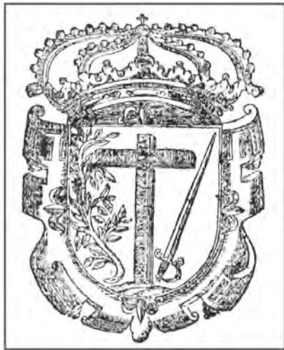
Escudo de la Inquisición.

principio quedaba sujeta a la autoridad del Tribunal, aunque su jurisdicción se extendiera más tarde a otras áreas.