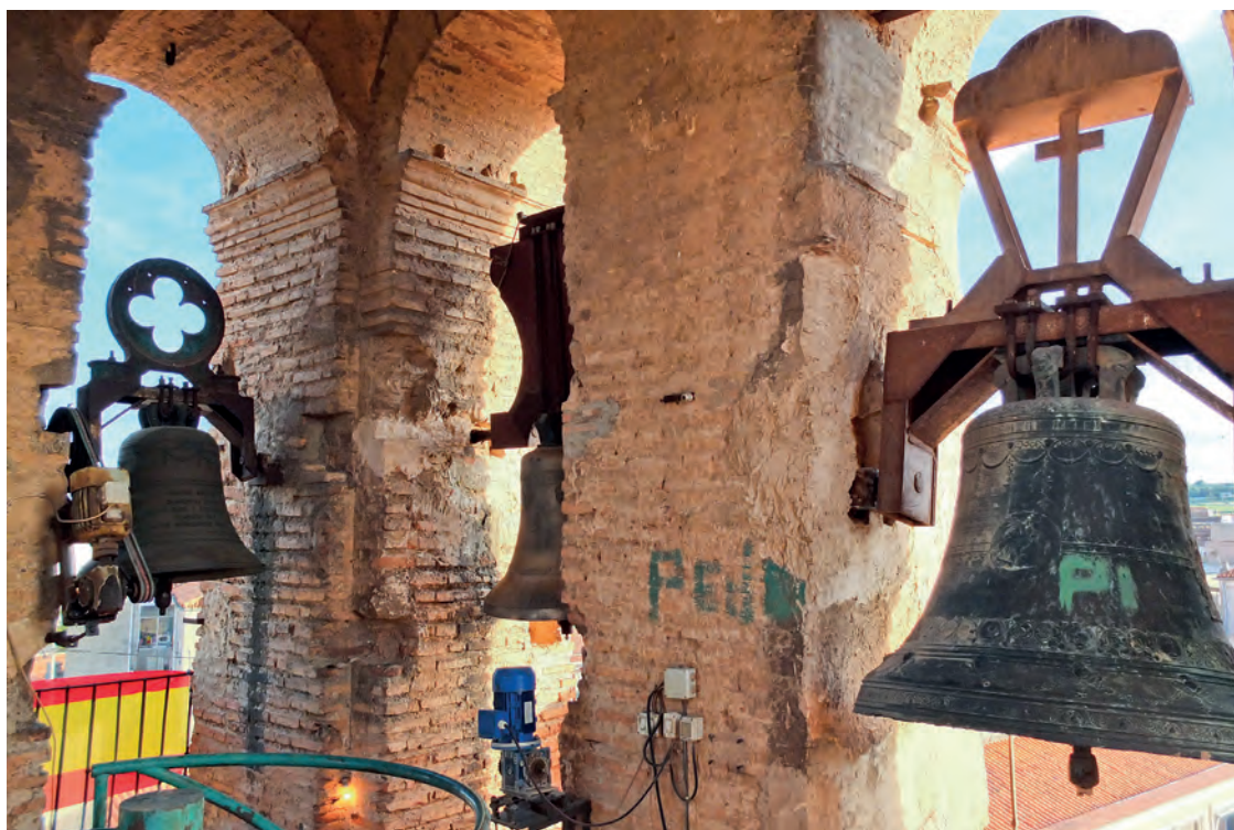
La fotografía muestra la instalación actual de las campanas, con yugos de hierro que modifican los sonidos y aumentan las vibraciones de las campanas. Además la motorización no puede reproducir los toques locales tradicionales, estando totalmente obsoleta.

El conjunto de campanas de esta torre no está compuesto por piezas antiguas, pero si que conserva una anterior a la Guerra Civil, que es la mayor, fundida por los Hnos. Roses de Valencia en 1925. La campana mediana resulta de escaso interés, fundida en el año 2000 y con el segundo contrapeso de hierro (que imita a madera) que tiene,