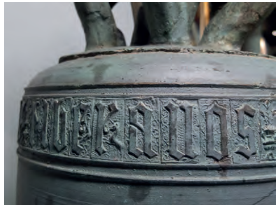
Detalles de la campana menor, la más antigua. Vemos la preciosa epigrafía gótica y ampliamente decorada que dice: ihs. mia. afulgure et tempestate liberanos domine. Que quiere decir: Jesús, María. Contra el rayo y la tempestad libranos Señor. (Sanchez 2003)