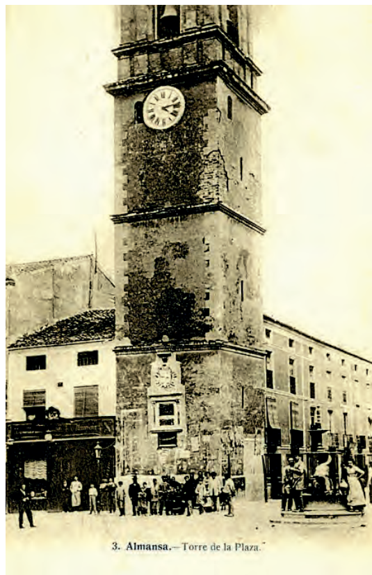
3. Almansa.—Torre de la Plaza.

Otros municipios con sendas torres para los toques de las horas son Almansa, Tobarra, Chinchilla, entre otros tantos. En el caso de Tobarra, la torre es de moderna construcción, y en el caso de Almansa, la torre se construye después de que el reloj ya hubiese estado en el campanario de la Asunción.