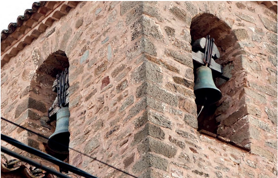
Las campanas más antiguas, que necesitan ser restauradas