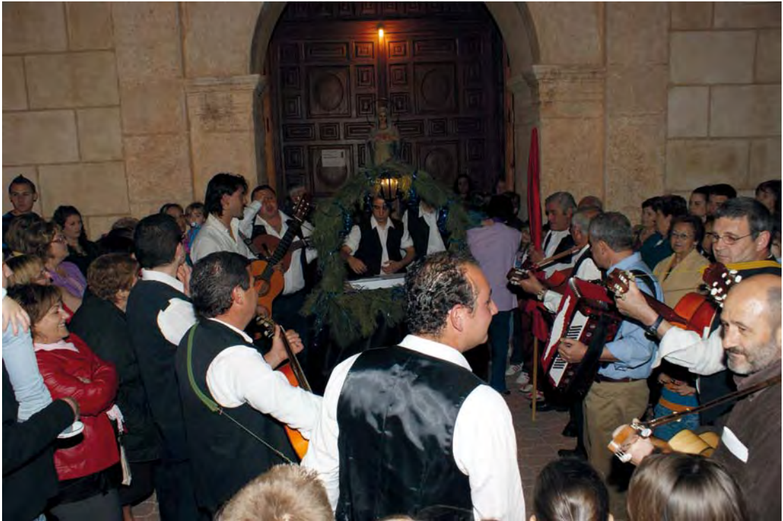
Foto Mayos. Año 2010

canciones no tienen gran valor, otras, en cambio, encierran una gran belleza artística, por su expresiva y original melodía sin antecedentes, y son como brotes de bellísimas flores entre brezos, zarzas y riscos en plena y soleada llanura, acentuándose aún más su original belleza por el medio en que surgen. Ejemplos de estas canciones son, entre otras, La Folia de Cañicosa, El Mayo de El Bonillo, Las Seguidillas Serranas y las Seguidillas con estribillo; que muestran que este trozo de tierra manchega encierra melodías dignas de tenerse en cuenta por su belleza y tradición” 18