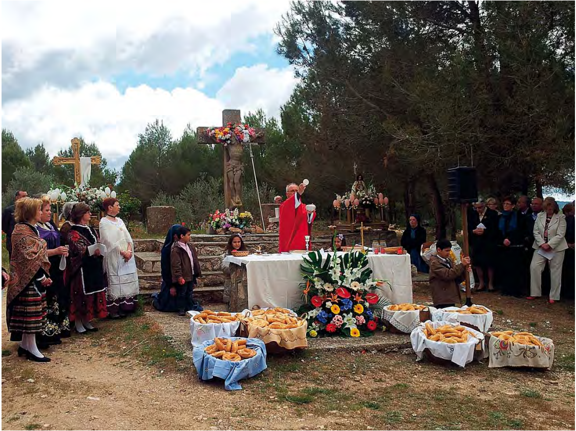
Santa Misa tras la procesión de la Santa Cruz. Balsa de Ves.

Ya sabe esta dama que obligada queda, a dar cinta y ramo que es correspondencia; la cinta al galán, el ramo al poeta.