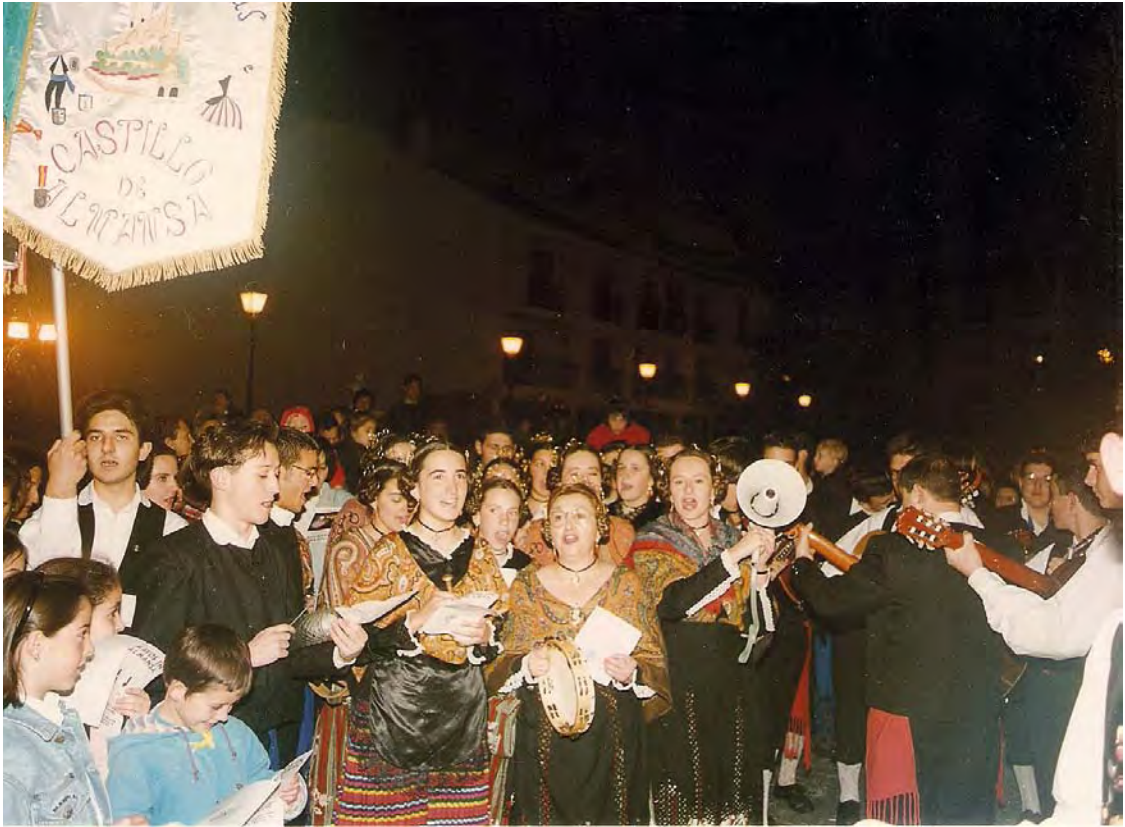
Mayos de Almansa de 1996.

Ya se acerca mayo, bienvenido seas, no traigas heladas, ni traigas pedreas.