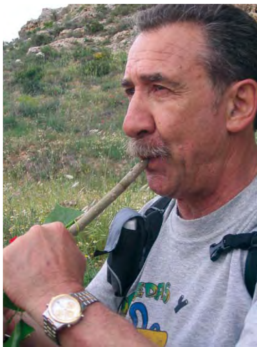
Pito de chopo.

También usaban de sonador en Villalgordo, como en otros muchos pueblos, la tabla de lavar . Es una madera con una superficie ondulada que se hacía sonar