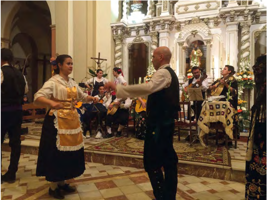
El Grupo de Coros y Danzas "La Romana" de Madrigueras bailando tras cantar los Mayos. Año 2016.

y termino por los pies. Mayo de Abengibre