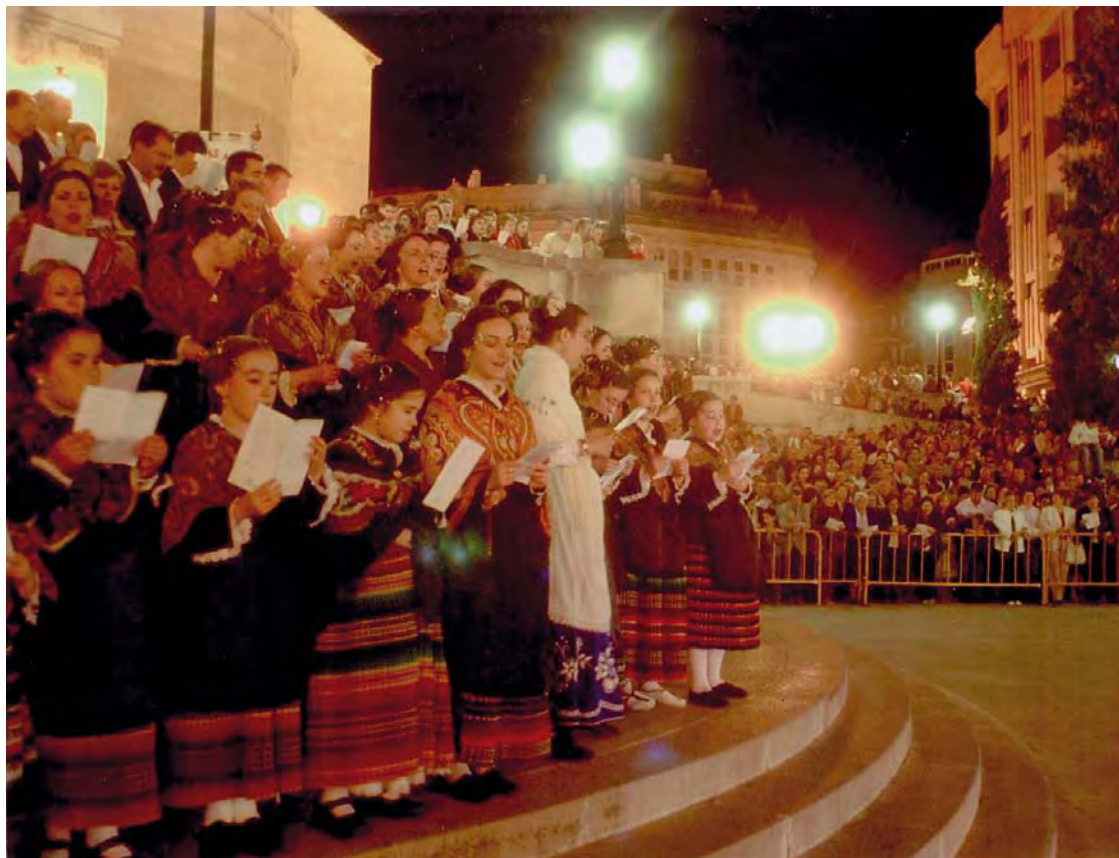
Mayos a la Virgen de los Llanos en la escalinata de la Catedral de Albacete, año 2011.

Adiós Virgen de los Llanos, échanos tu bendición, y con tus benditos ojos, míranos con compasión.