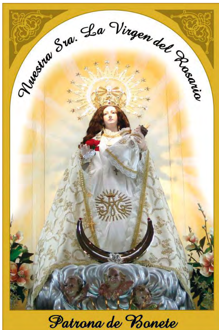
Virgen del Rosario

Canta la calandria responde el rodrigo, granán las cebadas, florece los trigos.