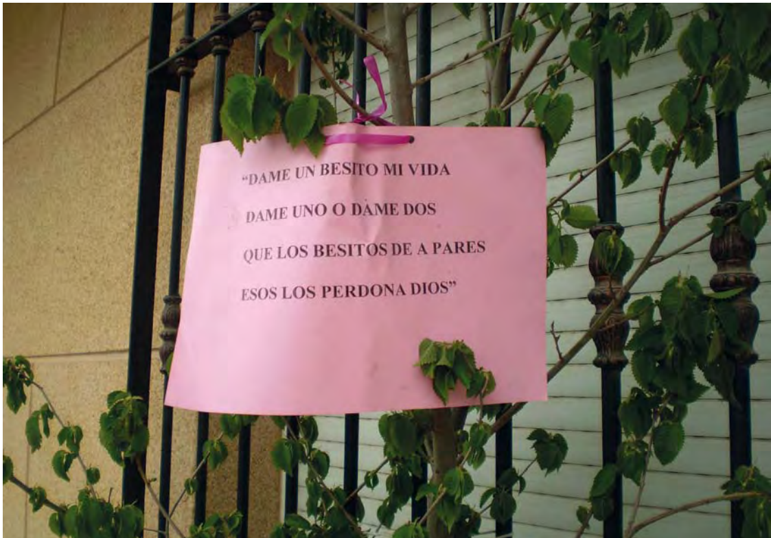
Enramá de los Mayos de Minaya. Año 2012

bos con cesura, otras) y el heptasílabo , también utilizado en el romancillo y en composiciones tan populares como la seguidilla. No obstante, poco que considerar, ya que es la forma más habitual para este tipo de manifestaciones literarias, que además, utilizan la asonancia como rasgo diferenciador en cuanto a la rima . Encontramos pocos ejemplos de rima consonante , puesto que como hemos dicho, en un principio, este tipo de coincidencia fónica estaba reservada a la poesía culta . No olvidemos, que estos versos nacen para ser cantados por el pueblo en unas fechas muy concretas y unas celebraciones religiosas y profanas.