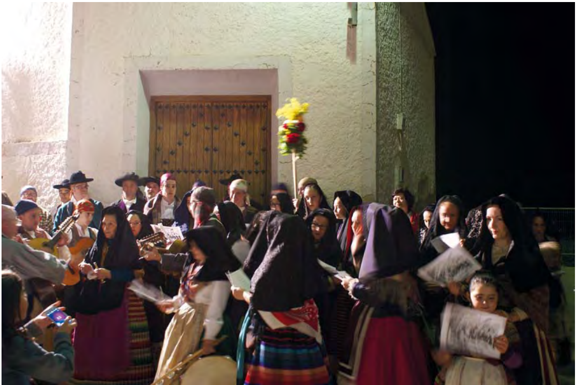
Ronda de los Mayos en la pedanía Santa Ana (Albacete).

go portugués Gil Vicente, en su Auto de la Sibilla Cassandra , de 1503. Se menciona este término a la manera de danza interpretada por pastores, y es notable, como por su estilo y etimología, el término hace referencia a que surge como una danza, eminentemente popular, que después doblará los mimbres donde se sustenta el verso popular del Mayo. Posteriormente, Covarrubias, en su Tesoro , la describe como una danza rápida y confusa, en la que los bailarines debían llevar sobre sus hombros a hombres vestidos de mujer. Con todo, sólo mencionar, ya que estas líneas son un análisis liviano del valor literario del Mayo, que las primeras composiciones fechadas con este nombre, son de finales del siglo XVI , fechas en donde Romanceros y Cancioneros , son gusto y moda de la masa y exponentes significativos de las representaciones poéticas populares.