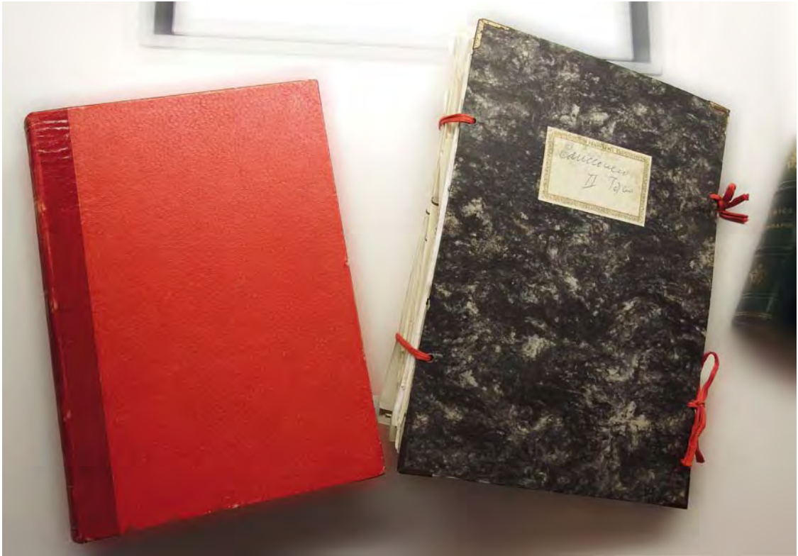
Documentos originales del Primer y Segundo Cancionero Inédito de M a Carmen Ibáñez Ibáñez. Fondos del Instituto de Estudios Albacetenses.

Perdonad, señora, mi débil torpeza, que ya estás pintada de pies a cabeza. Mayo de Villamalea