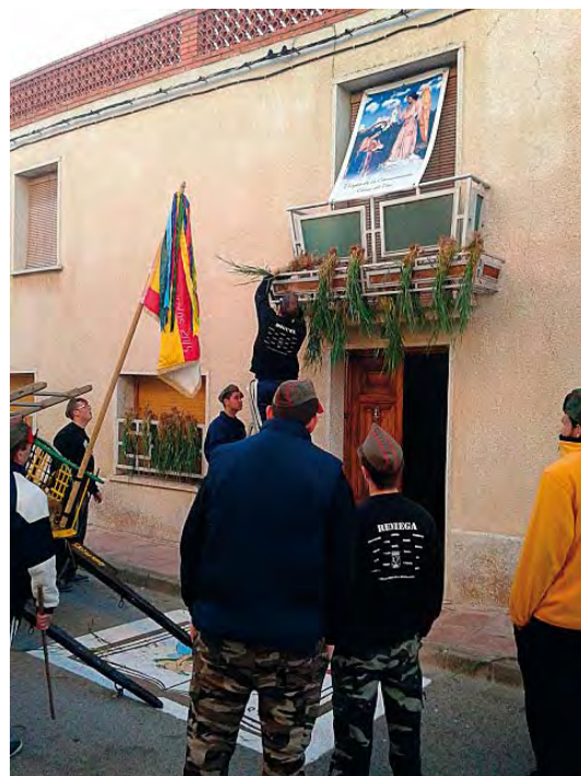
Quintos poniendo albricias en Casas de Ves.

Sobre la vigencia de la fiesta de los Mayos en Albacete encontramos opiniones muy contrastadas, tal vez por la época en la que las escribieron sus autores. M a Carmen Ibáñez , apuntó en los años 50-60 que solo se conservaba la costumbre de cantar, que estaba completamente muerta y que tendía a resurgir, merced a la constante investigación que se había hecho entre