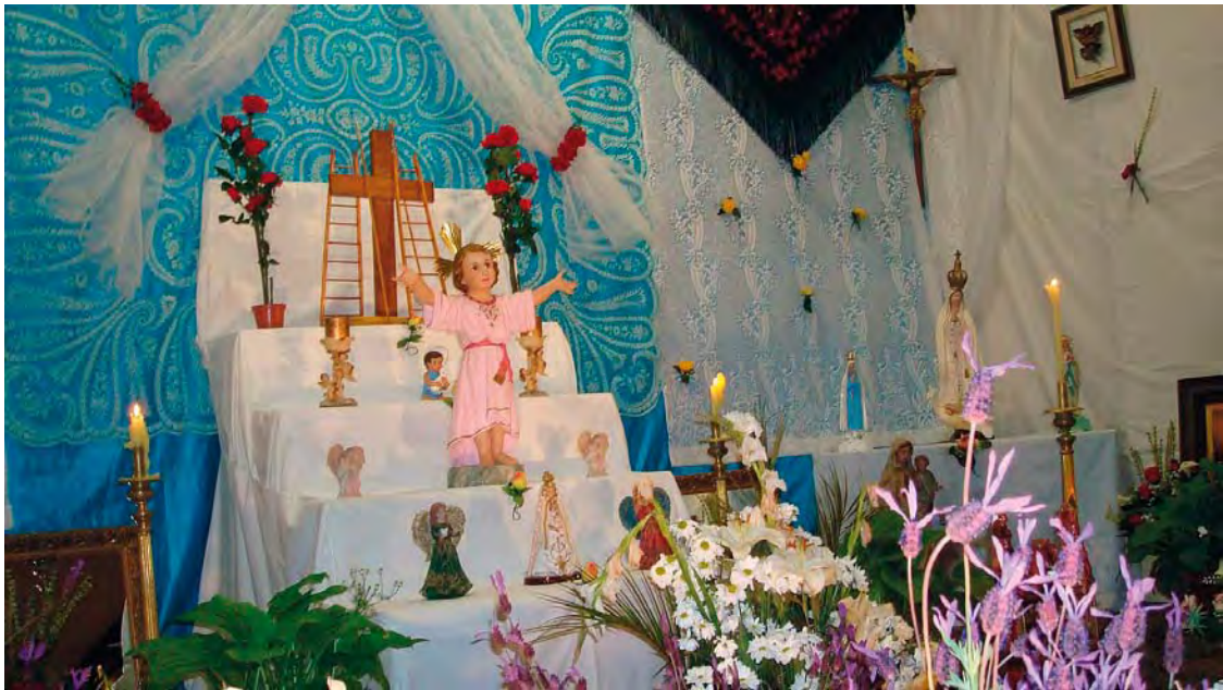
Cruz de Villapalacios, 2015. Foto de Rafael López Martínez