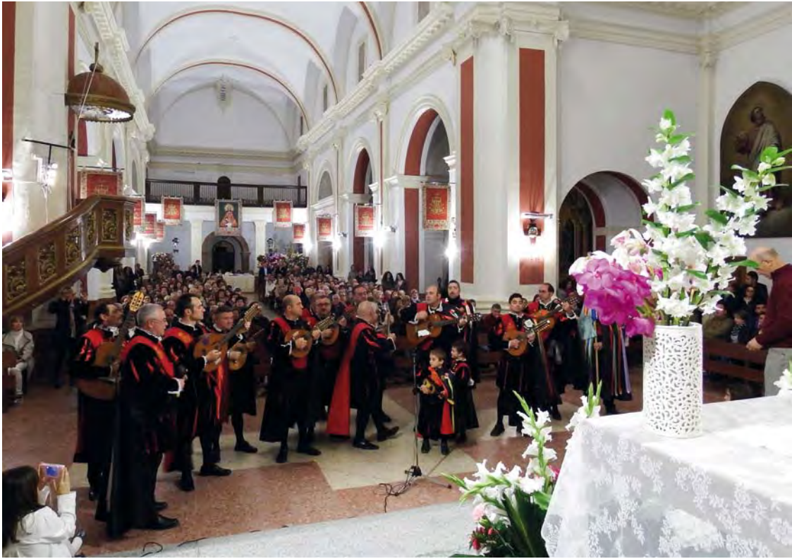
Tuna de Casas Ibáñez, cantando los Mayos a la Virgen. 2016.

Ahora, madama, te hago una promesa: voy a retratarte de pies a cabeza. Mayo de Fuenteálamo