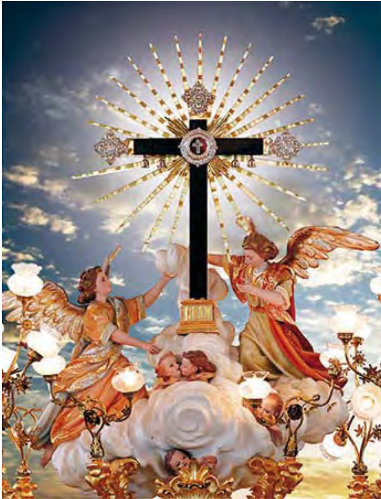
La Vera Cruz de Alpera

Te ha de echar un vitor que tiemble la tierra, a la Santa Cruz Patrona de Alpera.