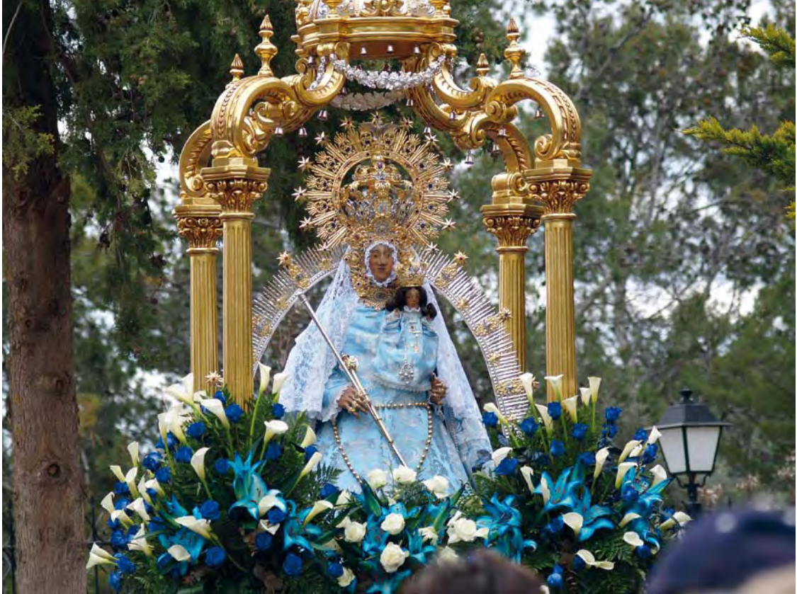
Virgen de Cortes en el momento del canto de los Mayos en su Romería, 2011.

¡Oh, Virgen de Cortes! retratada estás, a Mayo desdora tu gracia y bondad.