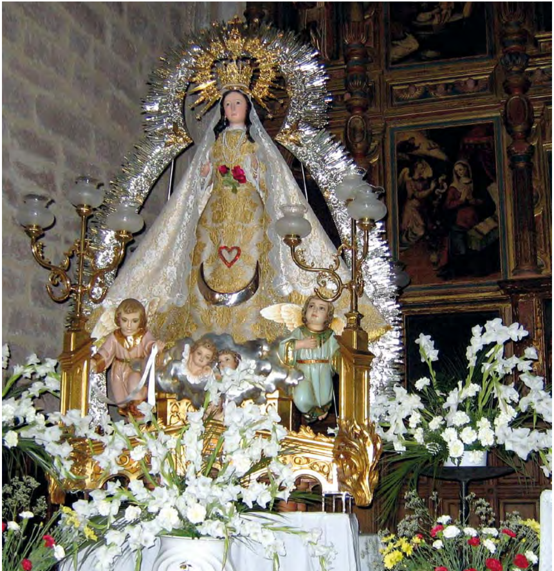
La Turruchela de Bienvenida, engalanada para recibir los Mayos dentro de la Iglesia.

Todos te miramos con mucho cariño, Madre Turruchela cuida de tus hijos. 60