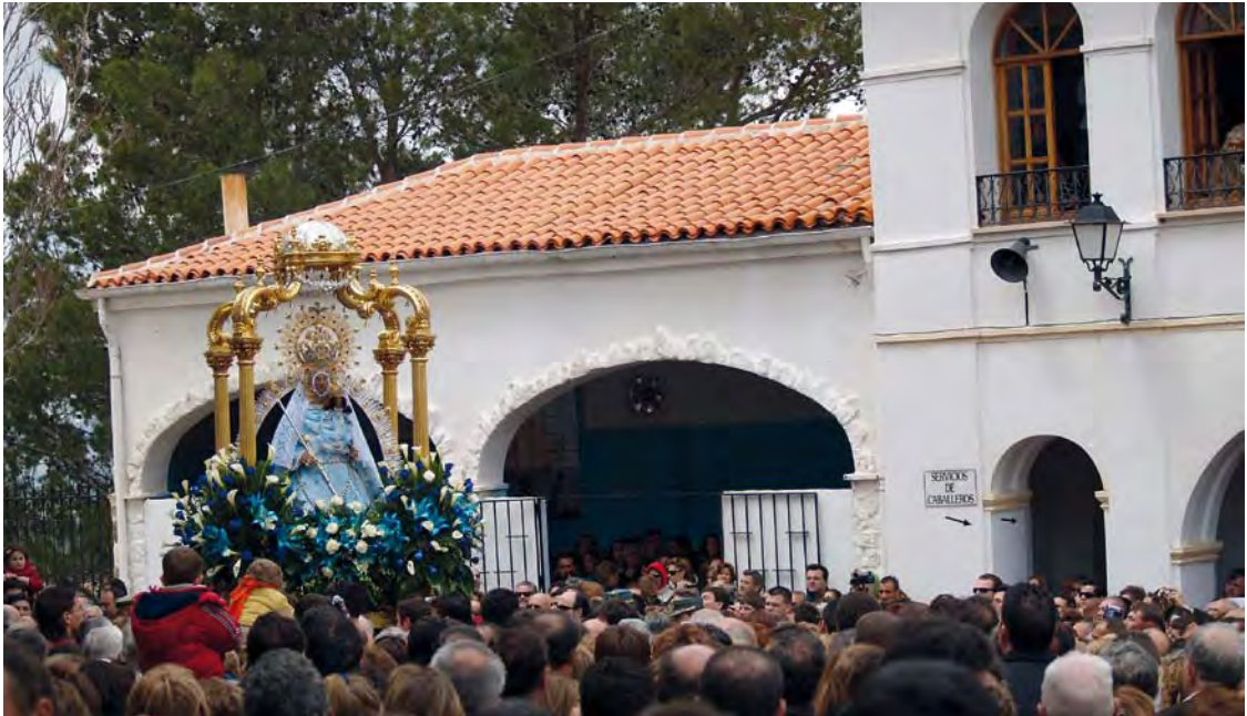
Mayos durante la Romería de la Virgen de Cortes (Alcaraz), 2011.

a Su imagen , más “sagrados”, con menos alusiones amorosas o vulgares. En algunas ocasiones, se acomodaron los textos de las descripciones de las mozas para retratar a la Virgen, “mezclando el elogio a la belleza de la Virgen con alusiones a la función sagrada de las partes del cuerpo de Nuestra Señora” ; apunta Díaz-Mas en su estudio 11 ; manteniendo, por tanto, la misma estructura que los Mayos-retrato a las mozas.