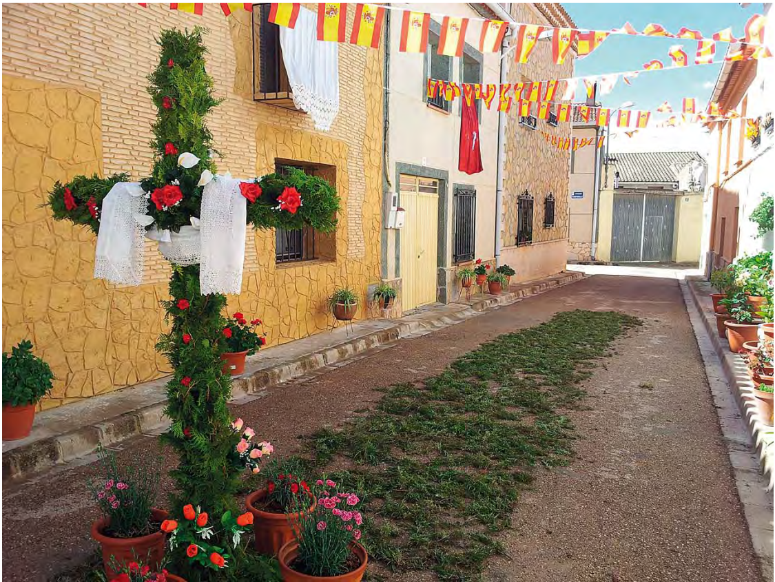
Cruz de Mayo con la que se adornan algunas calles de Balsa de Ves.

el Mayo a la Cruz de Santiago de Mora , una pedanía de Tobarra. Desgraciadamente solo contamos con un fragmento, pues es un interesante ejemplo que combina un retrato a la Virgen con escenas de la Pasión y Muerte de Cristo como estas: