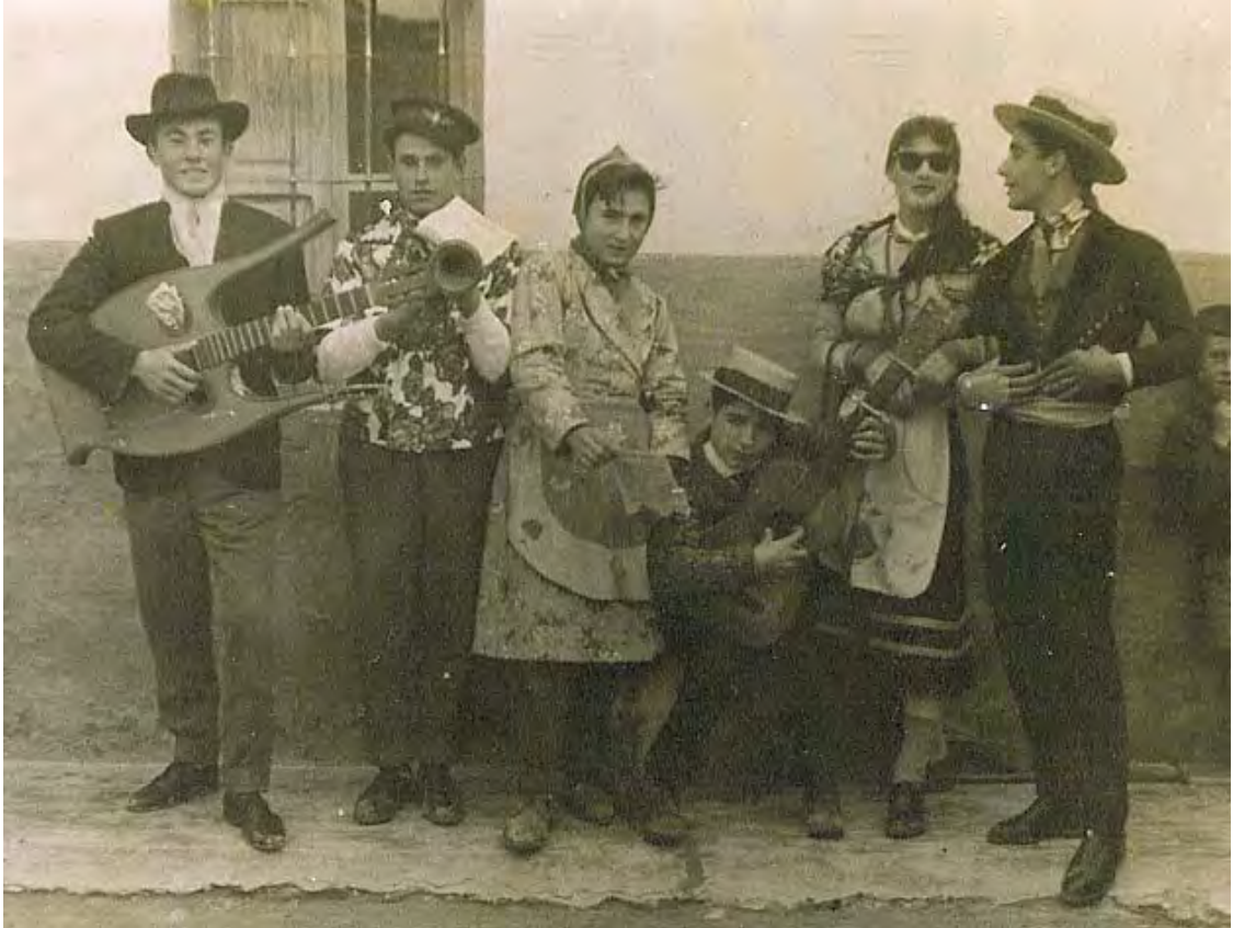
Mozos de Abengibre, dispuestos para la fiesta con guitarra-lira, trompeta y guitarra.

Regando cañadas, árboles y siembra, dando mil fragancias a la primavera.