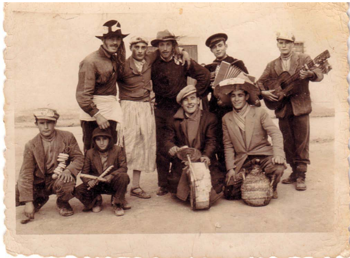
Grupo de jóvenes de Barrax con instrumentos musicales. Años 50

Bienvenido seas como deseado regando cañadas montes y sembrados.