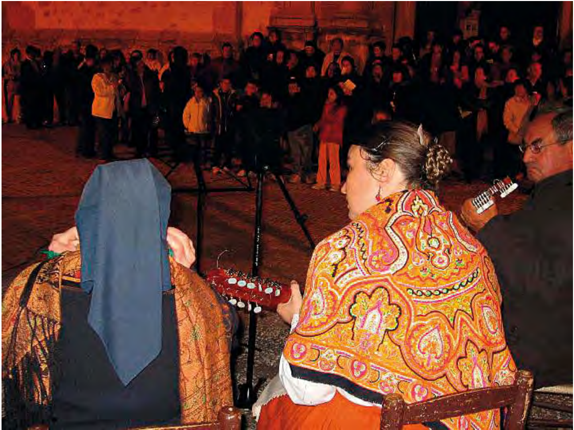
La Asociación Cultural El Garbillo cantando los Mayos.

Cortes en Alcaraz , de la Virgen de Sotuélamos en El Bonillo, o de la Virgen de los Remedios de Fuensanta ; aunque en estos casos el Mayo no se canta el último día de abril, si no en días posteriores, el 1 de mayo, en Alcaraz y El Bonillo, y el 3 en Fuensanta.