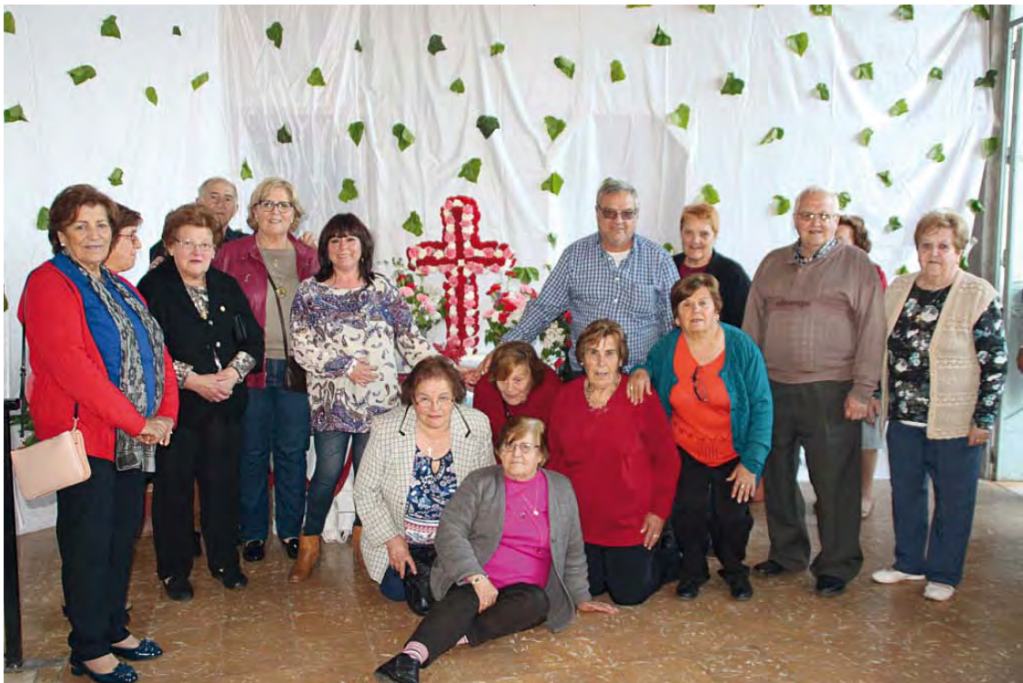
Muchas de las mujeres que contribuyeron a la recuperación de la tradición y visten la Cruz todos los años en Villaverde de Guadalupe, y algunos de los vecinos que cantan los Mayos. Año 2016.

Ojalá y esta recopilación sirva de base para rescatar algunas de estas manifestaciones del folclore albaceteño que hoy están completamente perdidas y como punto de partida para que etnomusicólogos de nuestra provincia hagan el estudio y análisis de esta manifestación musical tan bella que yo no he sabido hacer.