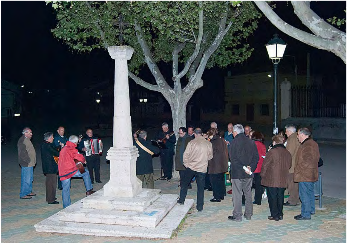
Mayos de Fuensanta al pie de la Cruz Blanca.

o Minaya, o por rondallas locales, como en Casas Ibáñez o Munera; mientras que en la mayoría de los pueblos era, y es, una buena voz masculina la que dirige la canción, que todos los asistentes repiten.