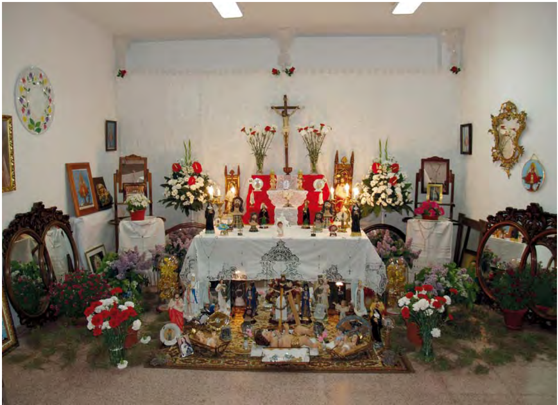
Cruz de Mayo realizada por la Asociación de Mujeres de Povedilla, año 2010.

del Mayo, antes de las estrofas finales que hablan sobre quién mandó cantarlo y las de despedida); o incluso un diálogo entre dos cantantes masculinos, como en Cañada del Provencio (Molinicos), donde se tiran “pullas” sobre el conocimiento que el mozo tiene de su amada y hasta dónde llega este.