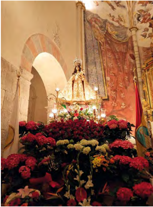
La Virgen de Cubas, de Jorquera, con sus andas llenas de flores en el día de los Mayos. 2016.

Mayo, mayo, mayo, bienvenido seas, que con tu venida las flores se alegran, regando cañadas, honrando doncellas, para que los galanes puedan pretenderlas. Mayo de Cañada del Provençio