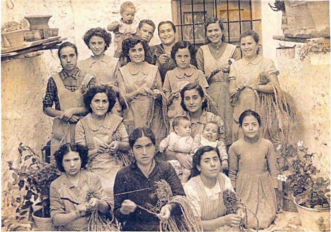
Mujeres y mozas de Ayna haciendo vencejos.

La señorita Amparo es más linda que una rosa y el señorito Marcial la pretende por esposa.