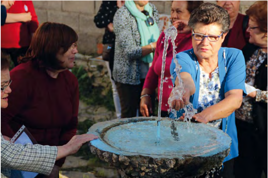
Bebiendo el agua bendecida tras el baño de la Cruz, en Villaverde de Guadalimar. Día de la Cruz 2016.

Júcar y algún otro; donde se cantaban los Mayos a la Virgen y a los muchachos a las mozas, para festejarlas. En sus Cancioneros transcribió 31 manifestaciones de 25 pueblos (24 Mayos, 5 de ellos son Mayos con Folías, y 6 Folías).