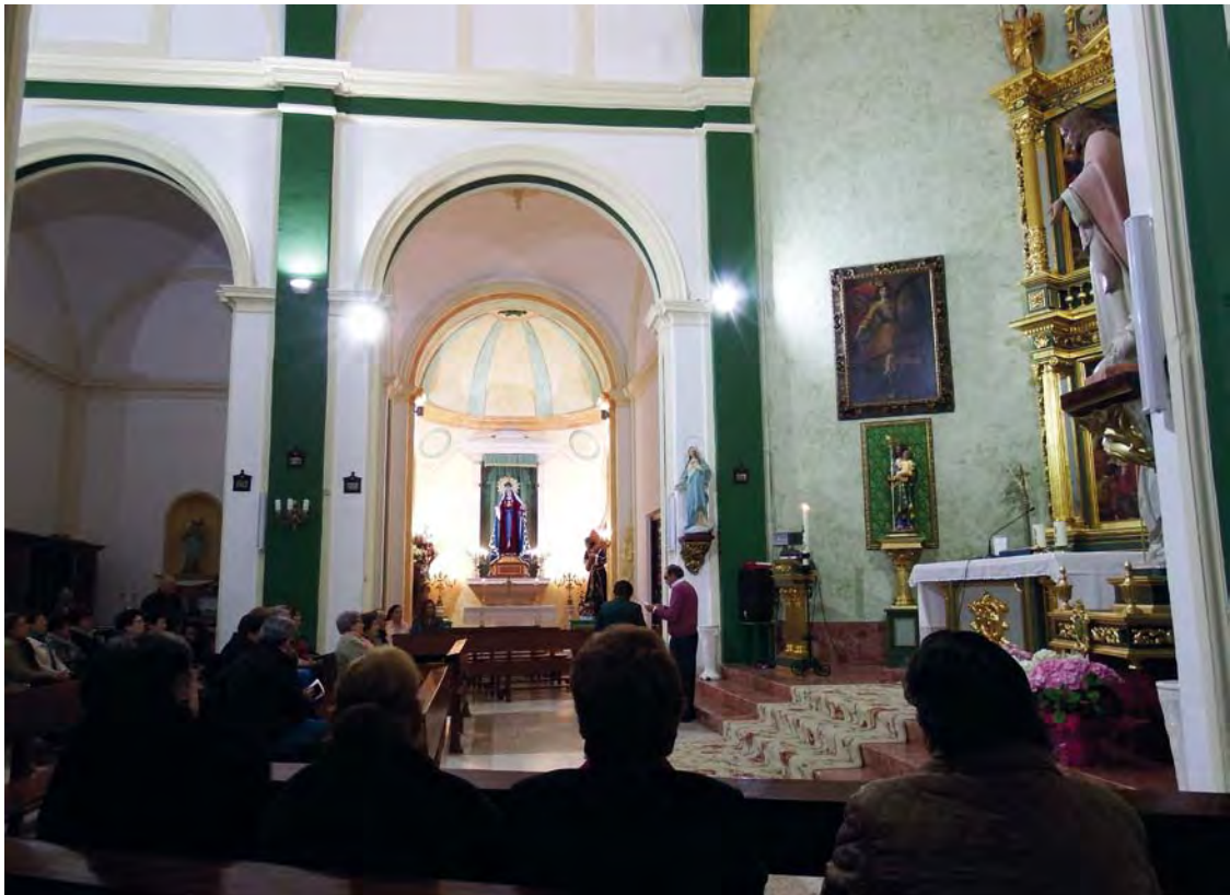
Mayos a la Virgen de Abengibre. Año 2016.