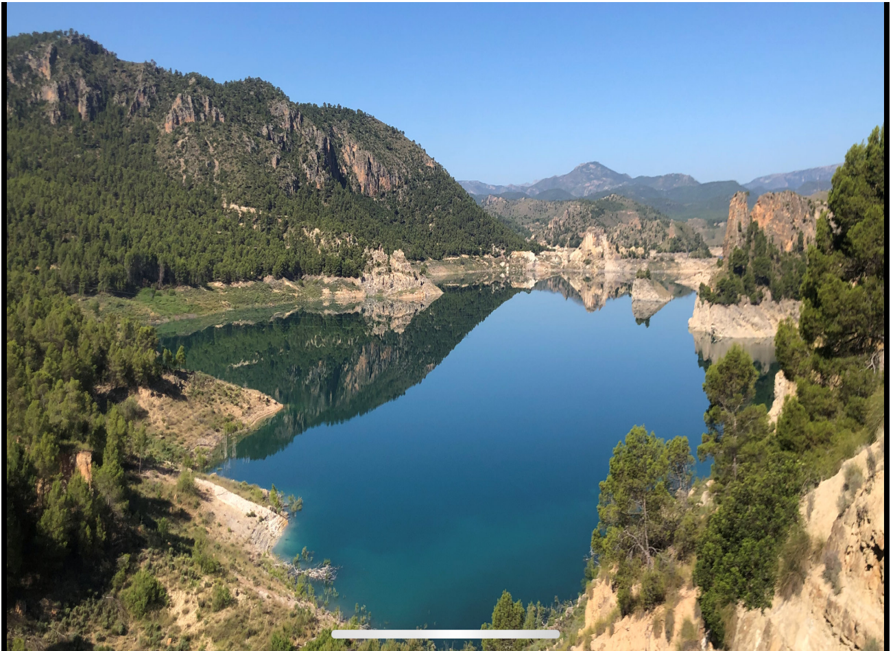
Pantano de la Fuensanta (Yeste).