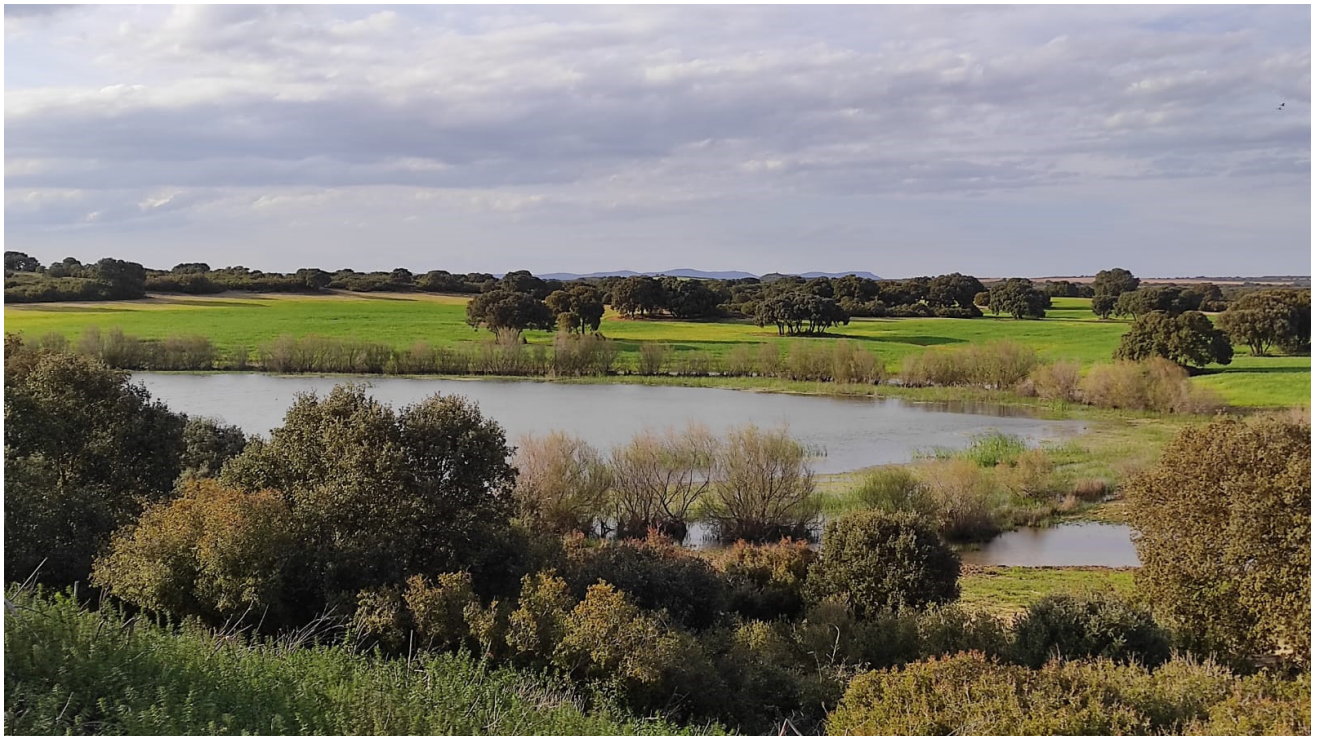
Lagunas de La Higuera, Corral Rubio (Albacete).