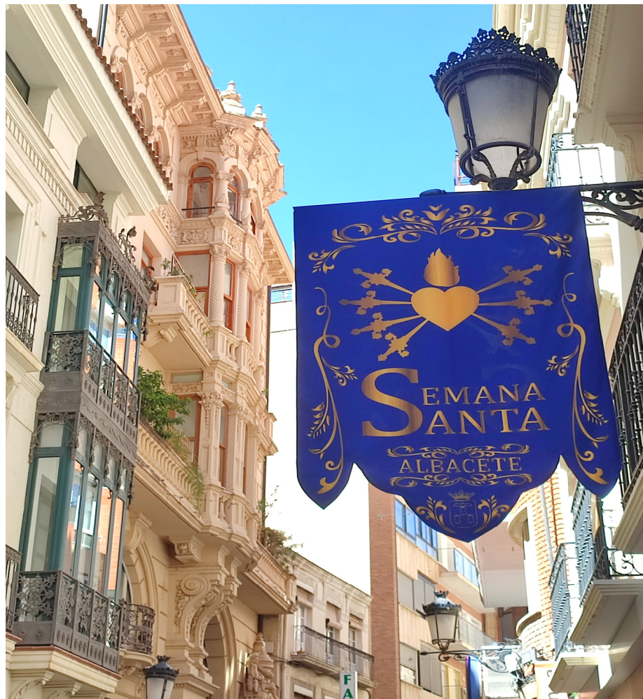
Calle Mayor, Albacete.