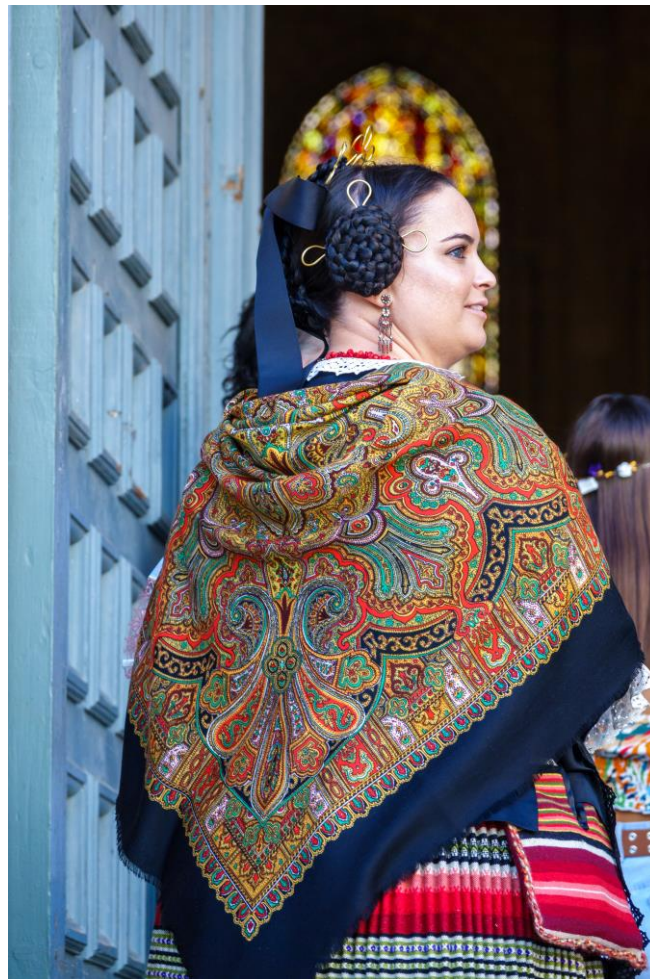
Manchega en la Feria (Albacete)