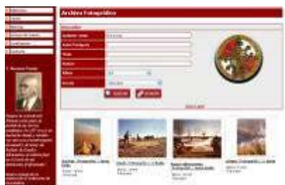
Archivo fotográfico para la investigación

Ya habíamos mencionado en números anteriores de la Gazeta el papel cada vez más importante de la página web del Instituto de Estudios Albacetenses Don Juan Manuel, con la permanente incorporación de contenidos de interés para los amantes de los temas de Albacete, así como para numerosos investigadores tanto de la provincia, como de fuera, que de esta manera tienen acceso a mucha más información sobre la provincia de Albacete. Es evidente que cada vez son más las menciones bibliográficas e incorporaciones de referencias e imágenes a muchos más trabajos de investigación regionales y nacionales. Desde los más sencillos que elaboran los estudiantes universitarios, a los más complejos de las ediciones de distintas editoriales o de tesis doctorales.