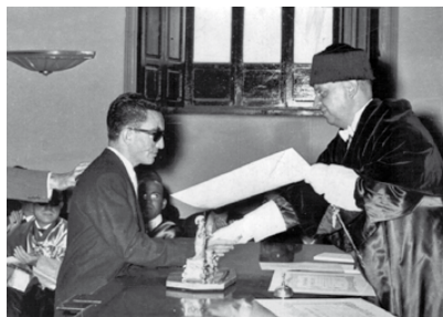
Entrega del Premio extraordinario de la Licenciatura, de manos del Rector de la Universidad de Murcia. Octubre 1956

Queremos reconocer la trayectoria de este filósofo albaceteño miembro del IEA, y se ha propuesto desde la Comisión Permanente del IEA, para que el Ayuntamiento de Albacete lo declare HIJO PREDILECTO de la Ciudad de Albacete, conforme al Reglamento de Honores y Distinciones Municipal, después del reconocimiento del que está siendo objeto a nivel nacional, como a continuación recogemos.