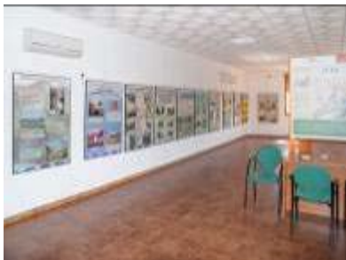
Vista de la exposición en la Casa de la Cultura de Pétrola

Constituyen la exposición 20 carteles (94 X 126 cm) y un poster explicativo (60 X 80) se puede acceder a sus contenidos en el siguiente enlace http://www.iealbacetenses.com/index.php?menu=6&ruta=8&id=240&opcion=0&pagina=1