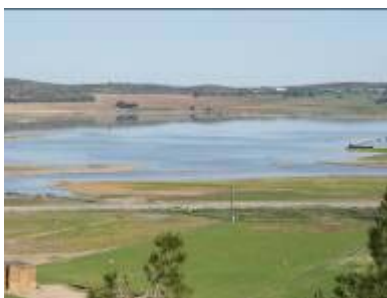
Laguna de Pétrola

La excursión se hizo coincidir con la inauguración de dos exposiciones del IEA en Pétrola: La del medio natural albacetense y la de ornitología de las Lagunas de Ruidera.