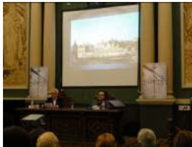
Un momento de la presentación de Madrid 1605

"La Berlina de Prim". Ante tan duro contrincante no es demérito obtener el segundo lugar de esta convocatoria.