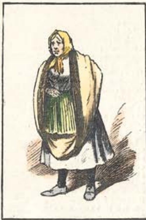
Una dama albacetense.