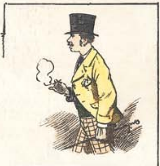
Al paseo de la Cuba, á no dejar un corazón sano.