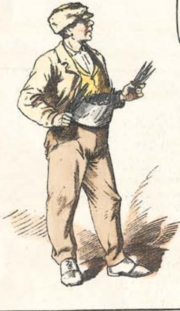
Navajas y puñales.