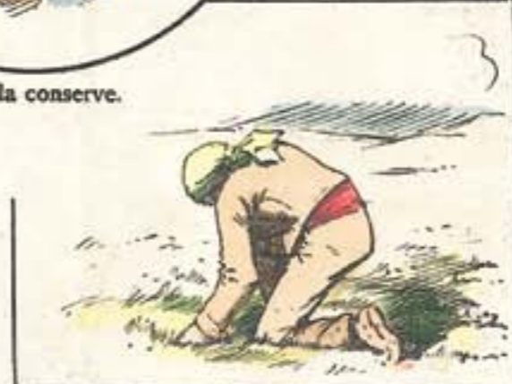
En el azafranal, cojiendo topos