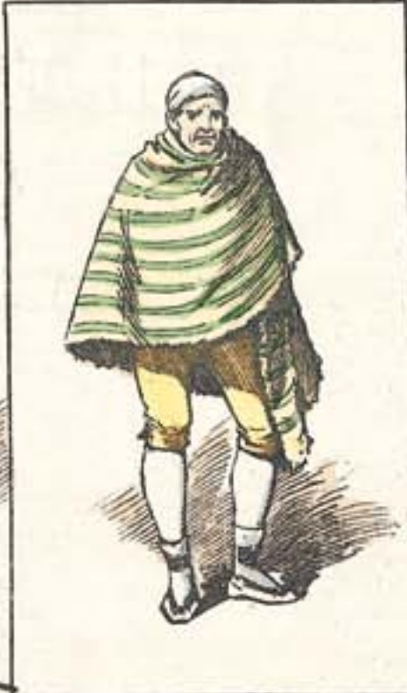
Un tipo clásico.