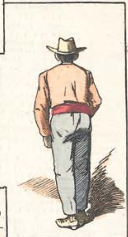
Un flamenco de por acá.