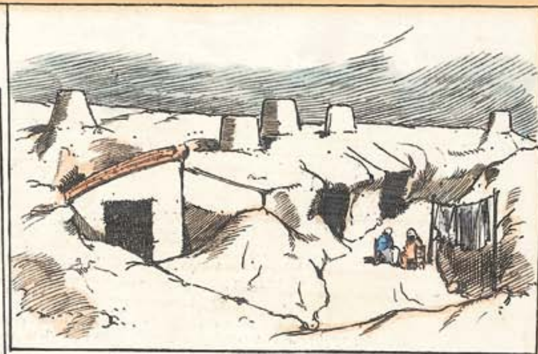
Los chalets del ensanche de la puerta de Valencia