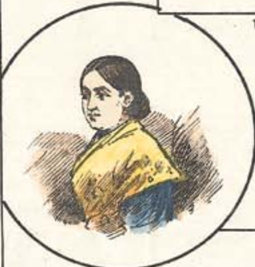
Dios la conserve.