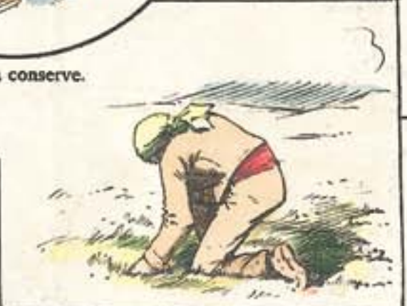
En el azafranal, cojiendo topos