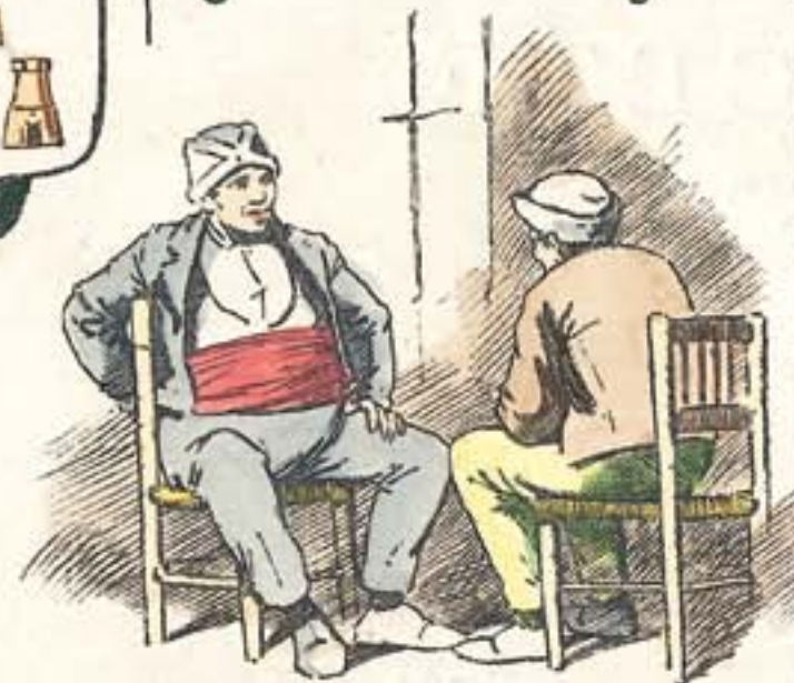
Hablando de la langosta... ¡como si lo estuviera viendo!