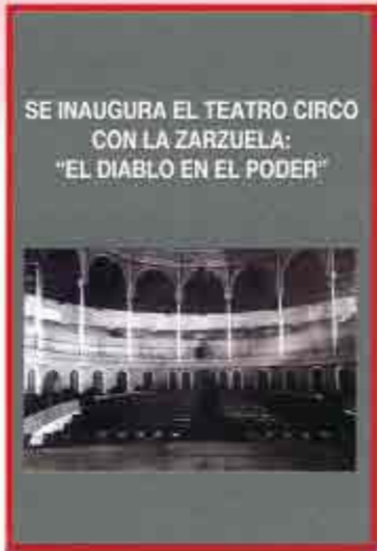
SE INAUGURA EL TEATRO CIRCO CON LA ZARZUELA: "EL DIABLO EN EL PODER"