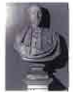
Muere el arquitecto Francisco Jareño