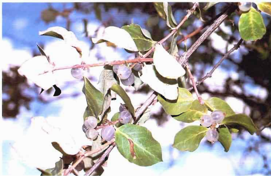
10. Lonicera arborea Boiss.