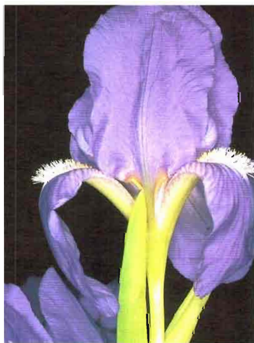
59. Iris subbiflora Brot.