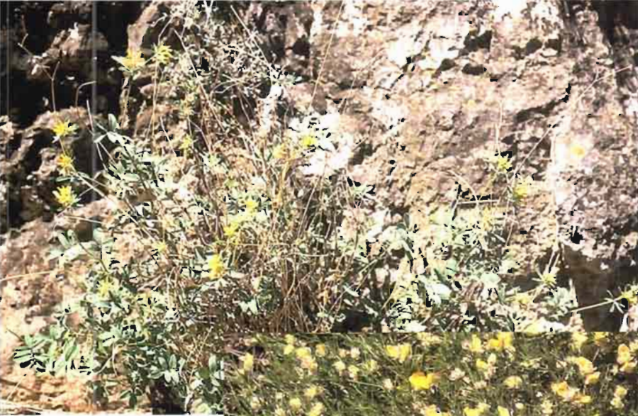
42. Anthyllis ramburei Boiss.