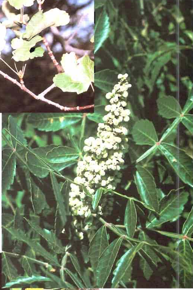
5. Rhus coriaria L.