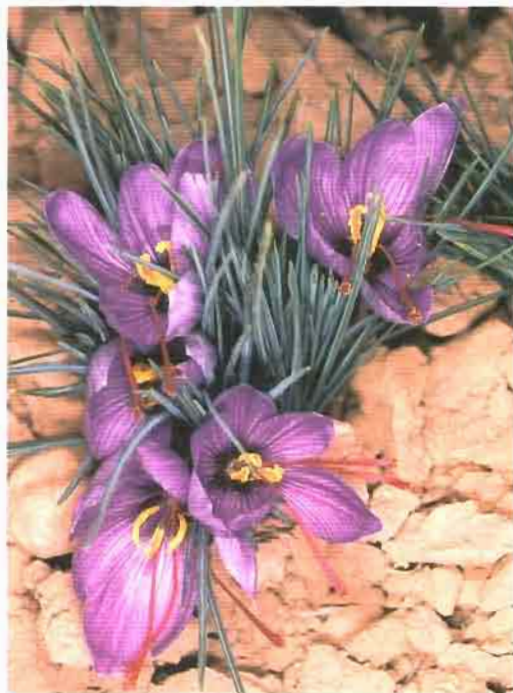
58. Crocus sativus L.