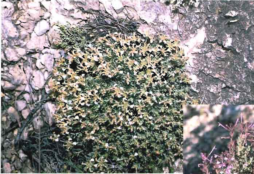
36. Teucrium rivas-martinezii Alcaraz & cols.