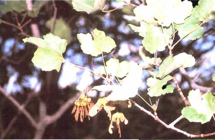
4. Acer granatense Boiss.