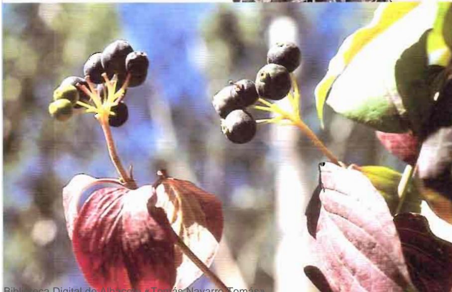
23. Cornus sanguinea L. subsp. sanguinea