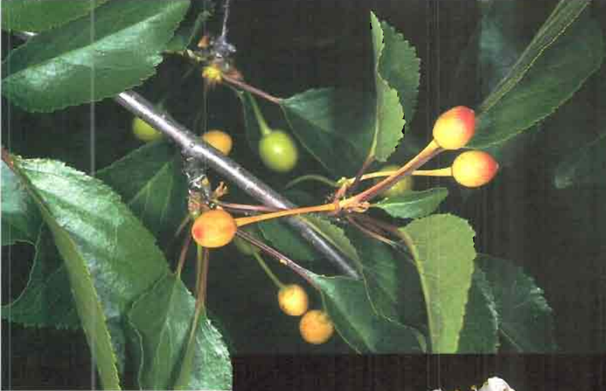
49. Prunus x fruticans Weihe