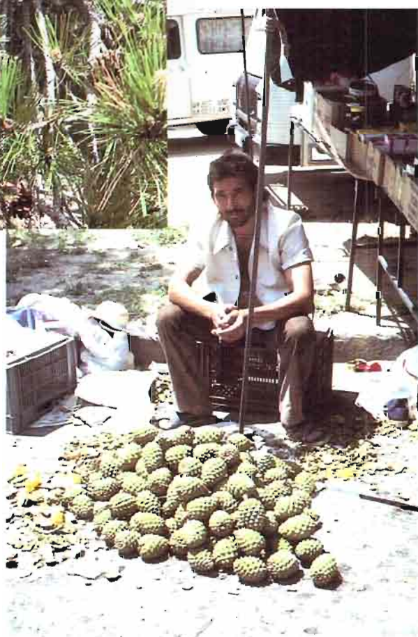
3. Pinus pinea L.