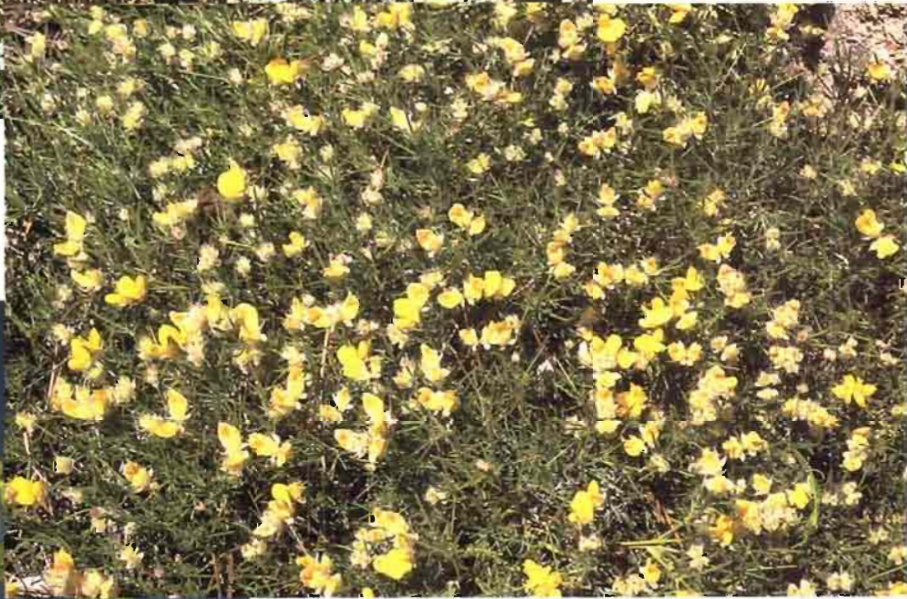
43. Echinopartium boissieri (Spach) Rothm.