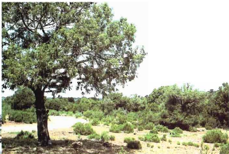
1. Juniperus thurifera L.