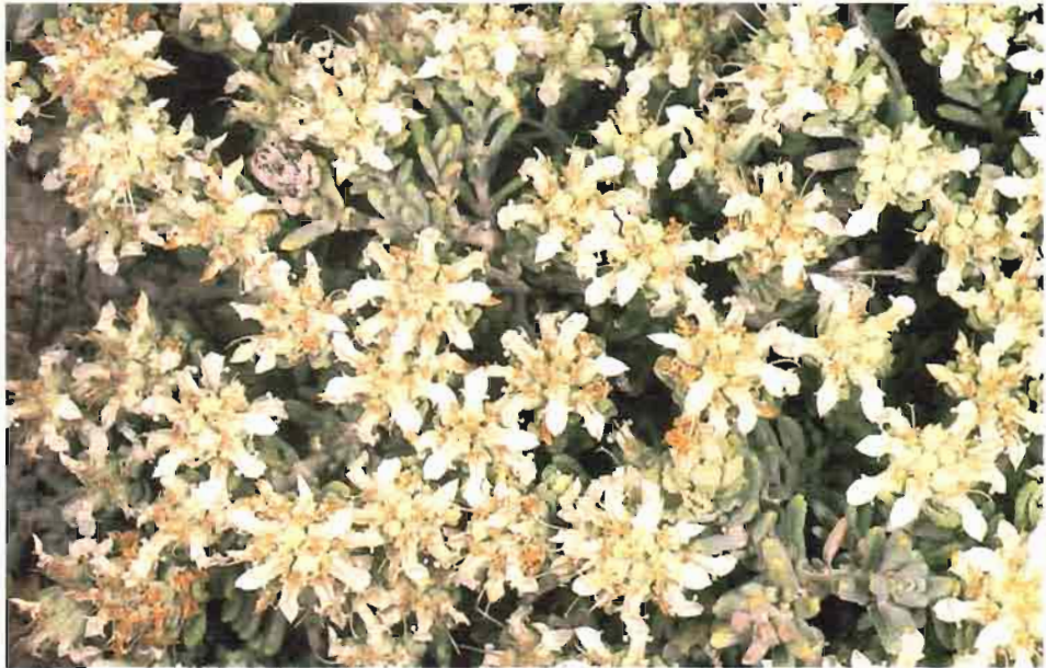
35. Teucrium leonis Sennen