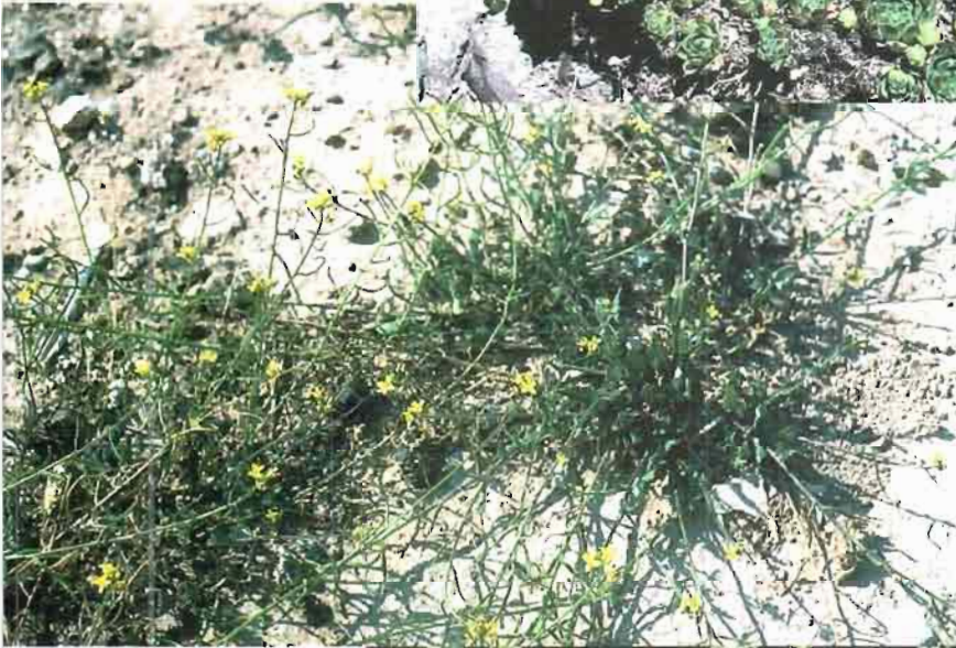
25. Lycocarpus fugax (Lag.) O.E. Schultz in Engl.