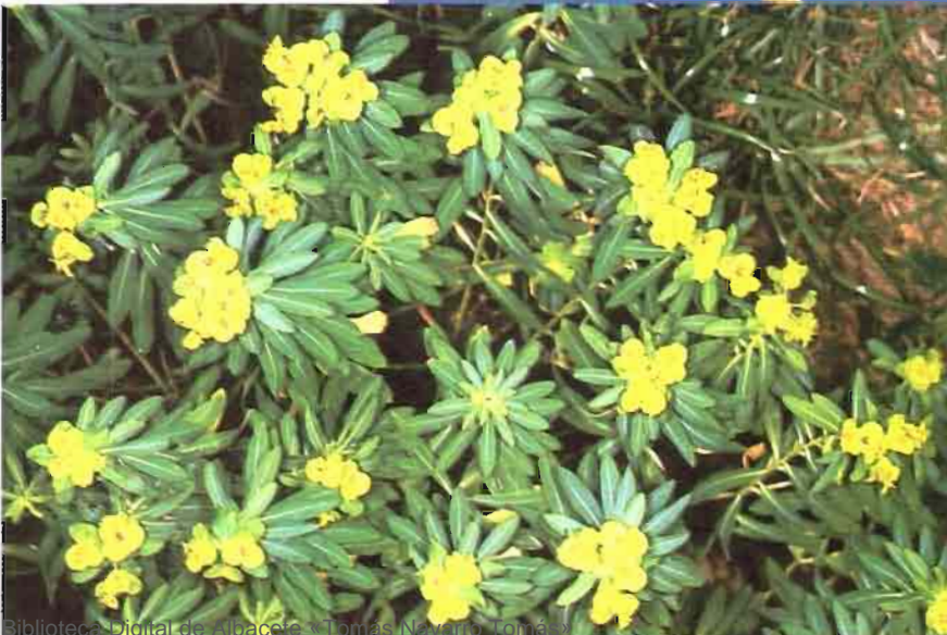
29. Euphorbia squamigera Loisel