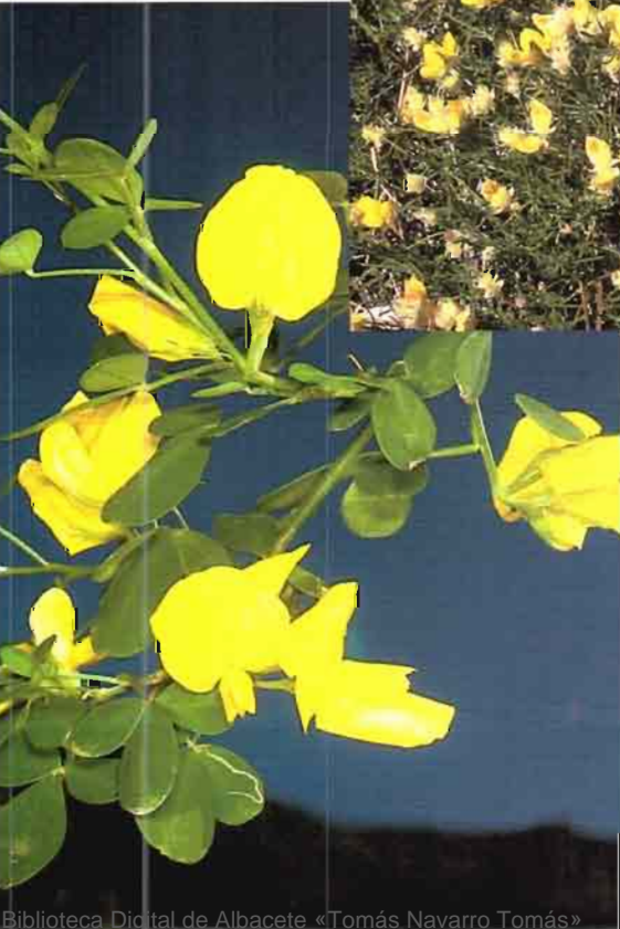
44. Teline patens (DC.) Talavera & P.E. Gibbs.