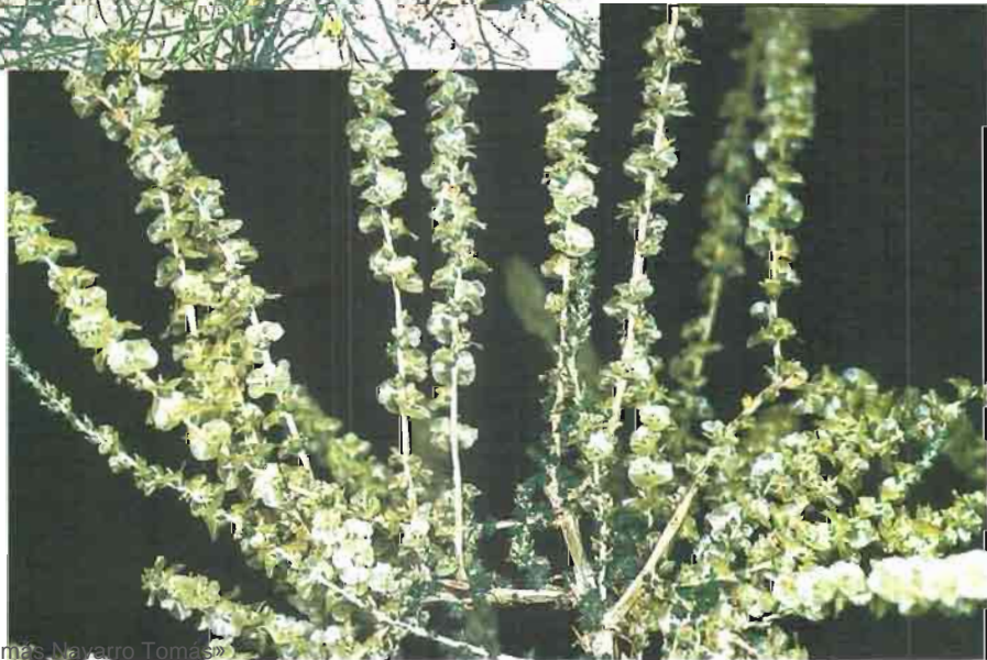
26. Salsola vermiculata L.