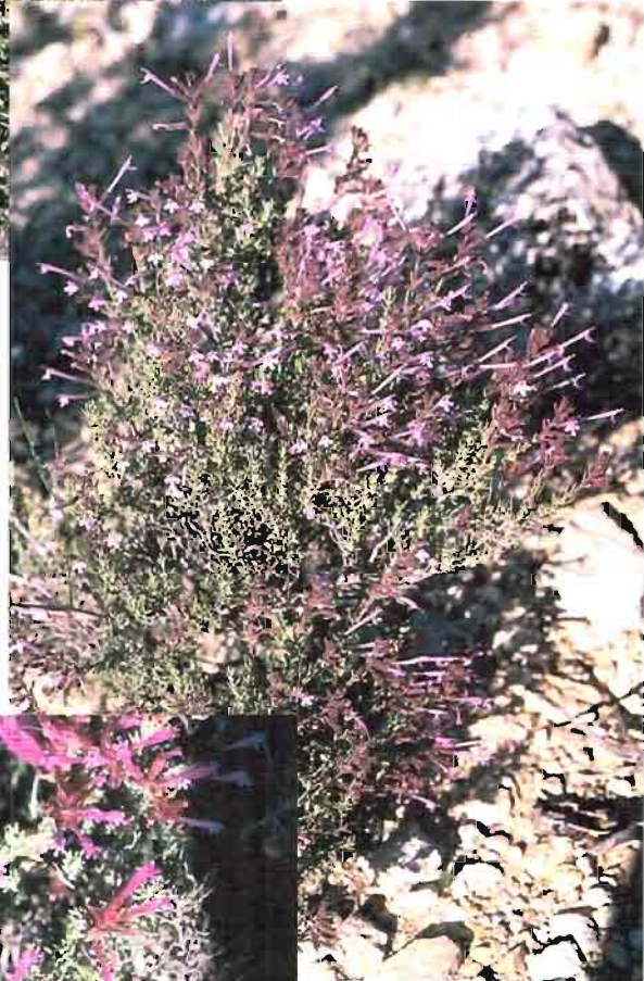
37. Thymus antoninae Rouy & Coincy