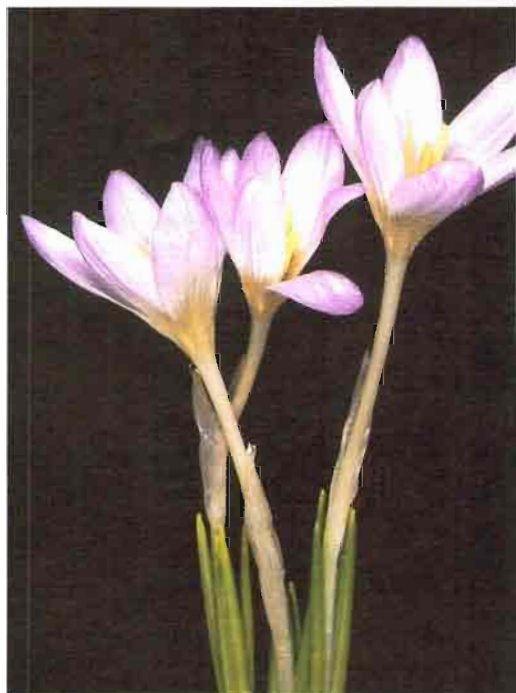
57. Crocus nevadensis Amo