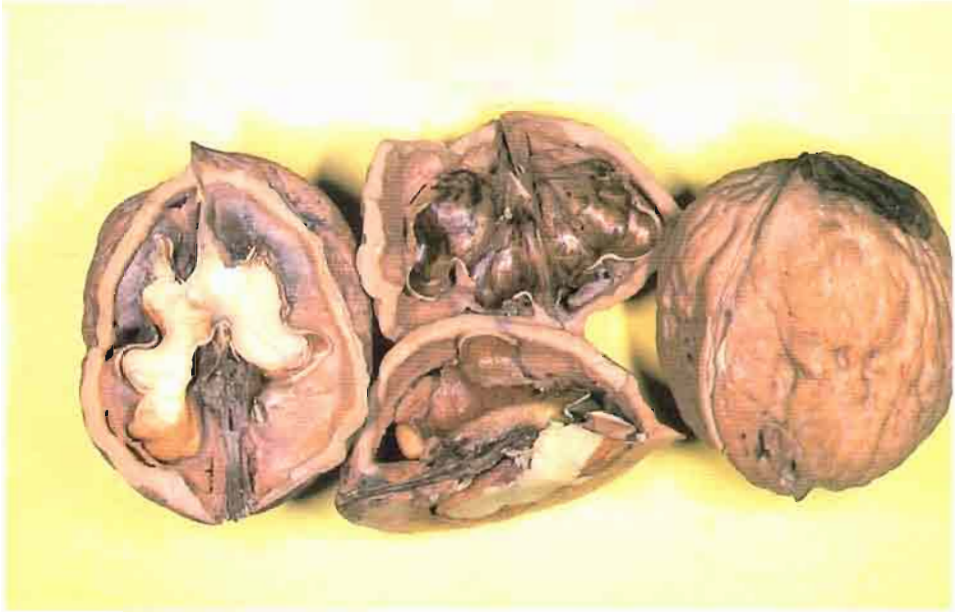
33. Juglans hispanica D. Rivera, Obón, Verde, F. Méndez & S. Ríos.