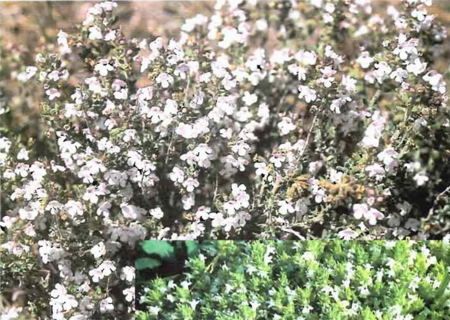
39. Thymus orospedanus Huguet del Villar