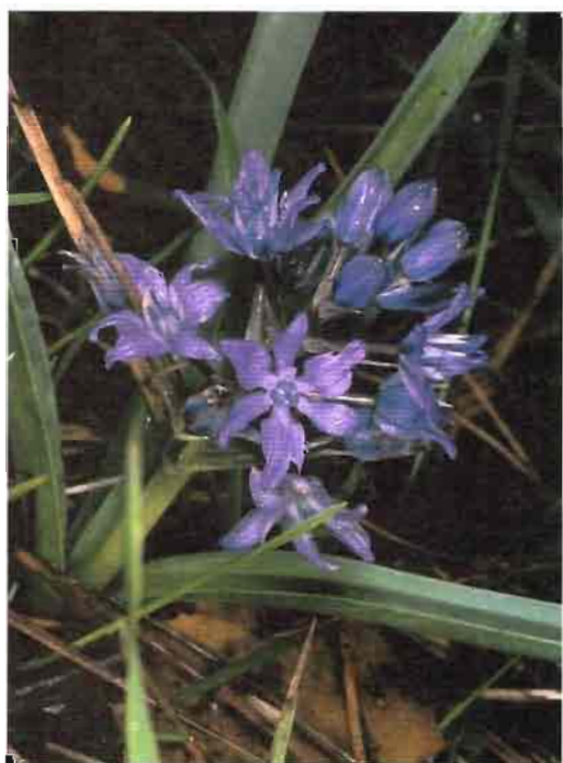
60. Scilla paui Lacaita