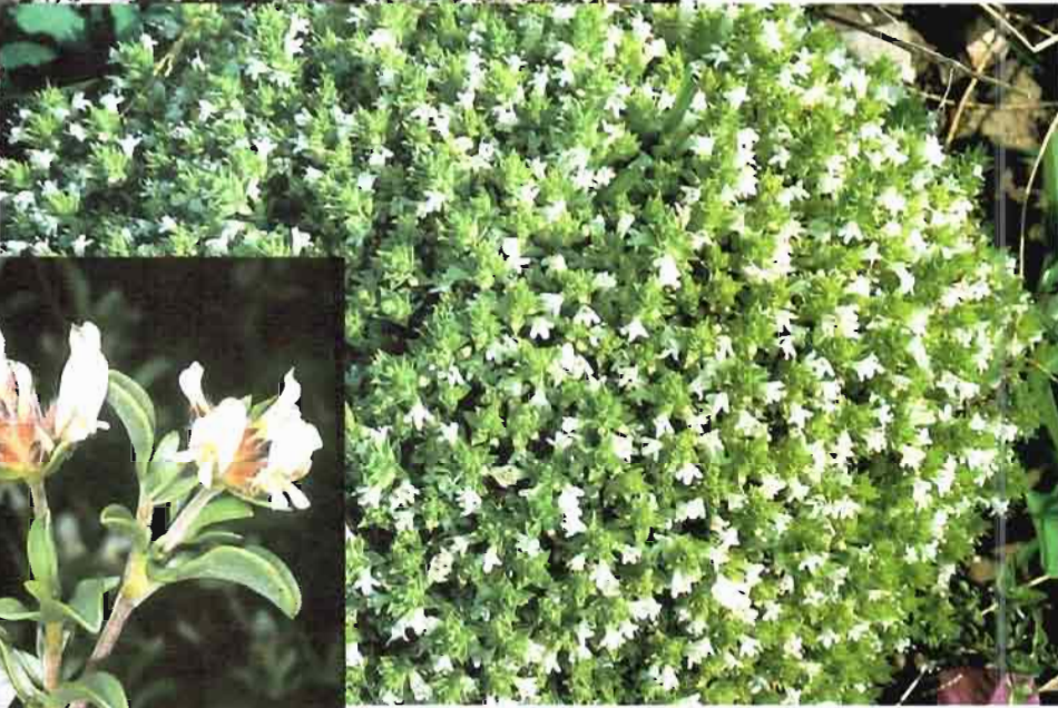
40. Thymus sabulicola Coss.