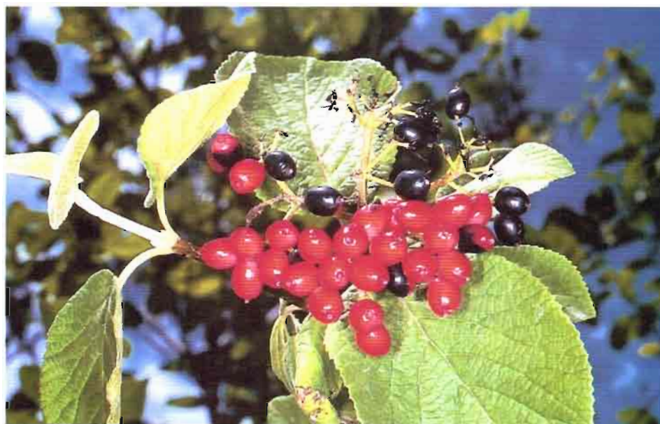
11. Viburnum lantana L.