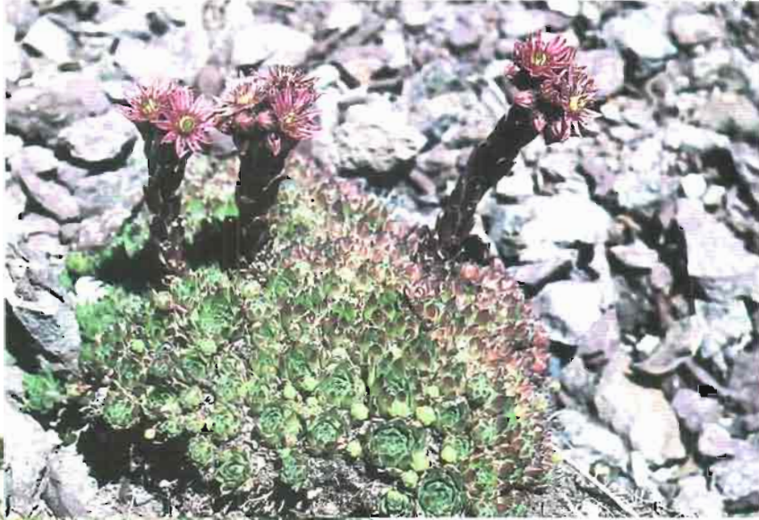
24. Sempervivum tectorum L.