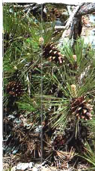
2. Pinus nigra Arnold subsp. mauretanica (Maire & Peyerimh.) Heywood