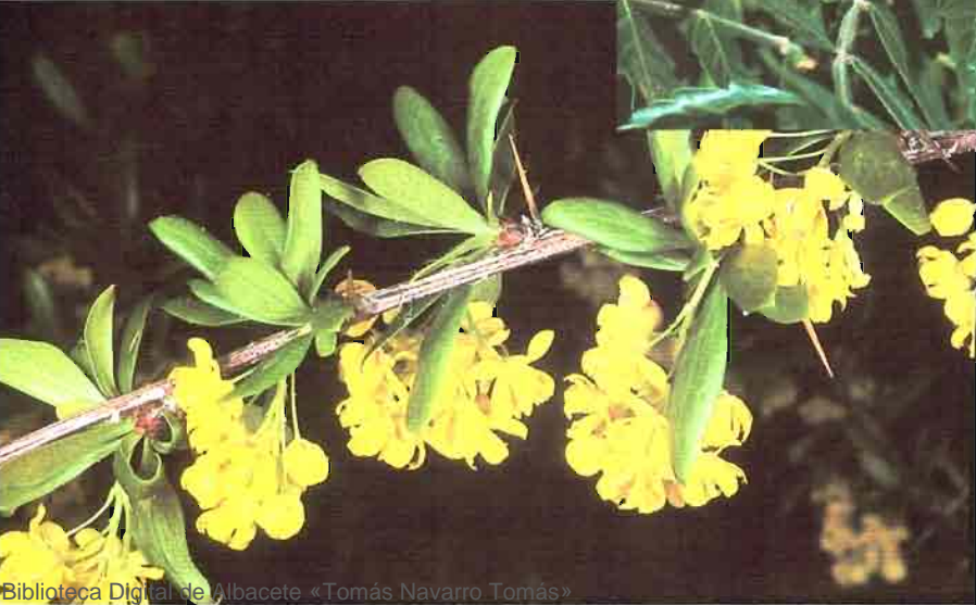
6. Berberis vulgaris L. subsp. australis (Boiss.) Heywodd