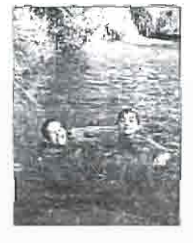
■ CAUCE DEL RÍO EN EL AÑO 1995. HOY YACE SECO

Restos de ramas y raíces quemadas es lo único que queda en el cauce natural del río Arquillo. Sus árboles han sido talados y sus aguas, ya sucias y pestilentes, se pierden a través de unas choperas por una pequeña presa artificial.