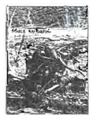
■ CAUCE ACTUAL DEL RÍO. TALA DE ARBOLES

depuradora. El río absorbe todas las aguas residuales que llegan al cauce. Son todos estos elementos artificiales de grave deterioro para esta zona húmeda de la provincia de Albacete, zona que está a punto de desaparecer por la erosión que viene sufriendo. M. MARTINEZ