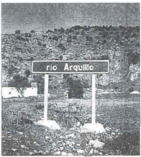
El río Arquillo ya es sólo un cartel.

Hoy está en grave peligro de extinción, pues aún se siguen utilizando cebos mortíferos que acaban con ellos, sin olvidar la libre, el corajo y sobre todo la perdiz roja, también en vías de desa-