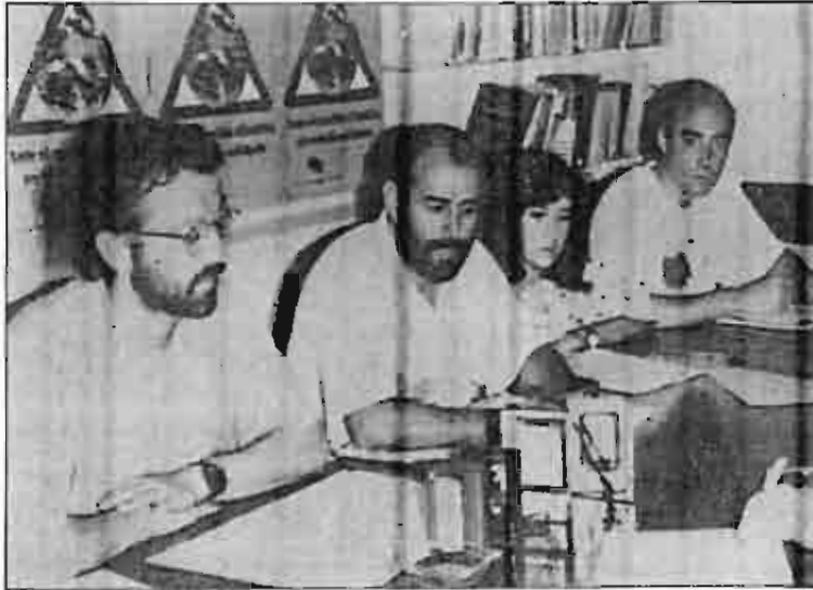
Presentación de las firmas de la ILP antinuclear.