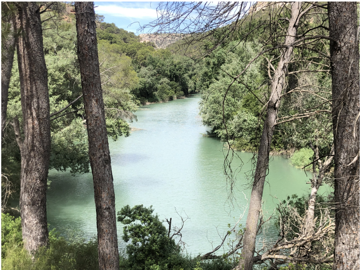
Río Júcar. Autor: Francisco Fernández Rosillo-Padilla