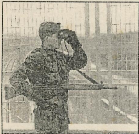
Soldados de reemplazo vigilan el AVE.