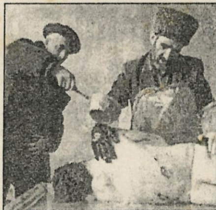
Dos hombres, ante el cadáver de un azerí.