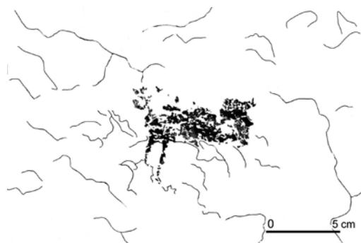
Fig. 10. Dibujo del motivo 5

Motivo 5. Alejado 1,60 m a la izquierda del motivo 4 documentamos una figura de cuadrúpedo. El cuerpo muestra una marcada forma rectangular. La cabeza se conserva muy parcialmente, aunque se advierte el morro, casi recto, y unos cortos trazos en la parte superior que debieron ser parte de la cornamenta del animal o las orejas. De las extremidades solo se conservan las delanteras, de trazado rectilíneo. Mide 8 cm de longitud. Color rojo (figura 10).