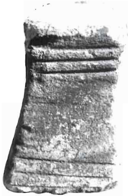
Lámina I. Cerro de los Santos. Ara votiva.