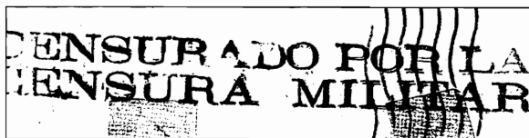
Segunda marca de censura conocida de las B.I. en Albacete

Estas dos marcas son las primeras de las muchas que luego se reconocerán cómo específicas de las Brigadas Internacionales 12 , correspondiendo todos los efectos que hemos podido observar, a los meses de diciembre de 1936 y enero del 1937.