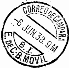
Fechador de la Brigada Móvil de B.I.

considera a Francia y Checoslovaquia, como países sin limitaciones, esto es, los únicos a los que los brigadistas pueden certificar y enviar por correo aéreo 1 , debiendo utilizar para los demás destinos y el correo ordinario el franqueo mecánico del que hemos hablado anteriormente, ubicado en la Estafeta de Valencia. Además de este modo de franqueo por cuenta del Estado, para la correspondencia con países poco afectos a la causa republicana, durante un amplio periodo, entre agosto de 1937 y mediados de Mayo de 1938, se establece el llamado "COURRIER SERVICE", ubicado en París, y que se encargará de recibir el correo ya censurado de la base de Albacete, y franquearlo con sellos franceses o mediante el franqueo mecánico C1724 y C.W006 de la oficina "PARÍS 83" situada en la "rue Bleue, nº 14" de la capital