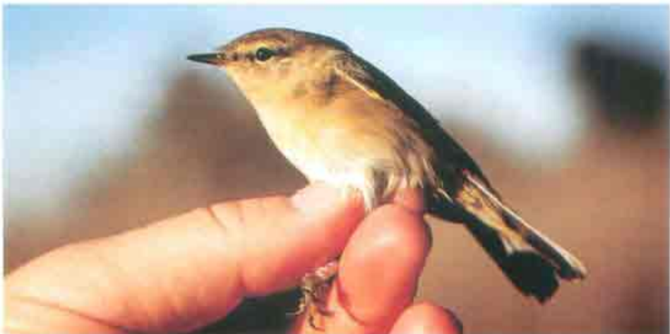
Figura 40. Mosquitero Común ( Phylloscopus collybita ).

Las características biométricas apreciadas para esta especie fueron: Ala (jóvenes) 50-64.5 mm, media 57.22 (n=27); (adultos)= 55-64 mm, media 60,40 (n=5). Tarso (jóvenes)= 17.6-20.7 mm, media 18.79 (n=27); (adultos)= 18,2-20,1 mm, media 19,16 (n=5). Peso (jóvenes)=6.5-10.5 grms, media 8.18 (n=27); (adultos)= 7.5-9 grms, media 8.10 (n=5). Grasa : (jóvenes)= 3-5, media 3.74, moda 4 (n=27); (adultos)= 3-5, media 3.80, moda 3 y 4 (n=5).