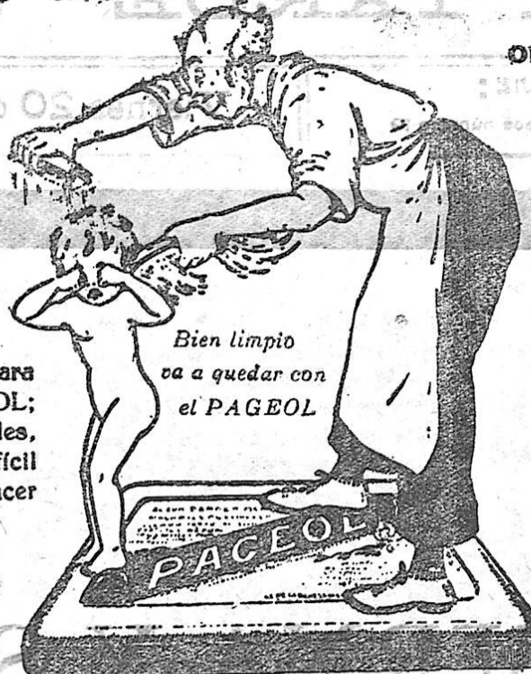
Bien limpio va a quedar con el PAGEOL

Blenorragias agudas y crónicas Prostatitis Estrecheces Albuminuria Cistitis