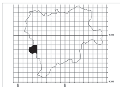
Figura 9. Distribución de Asplenium celtibericum en la provincia de Albacete.