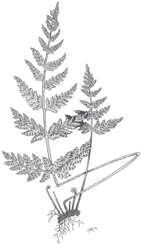
Figura 14. Aspecto de los individuos de la especie (A) y disposición de los esporangios en la fronde (B). Román Belmonte.