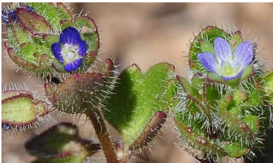
Figura 24. Veronica triloba (izquierda) y V. hederifolia (derecha). Vista comparativa del extremo de un tallo con flores.