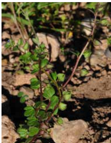
Figura 25. Veronica triloba . Hábito.