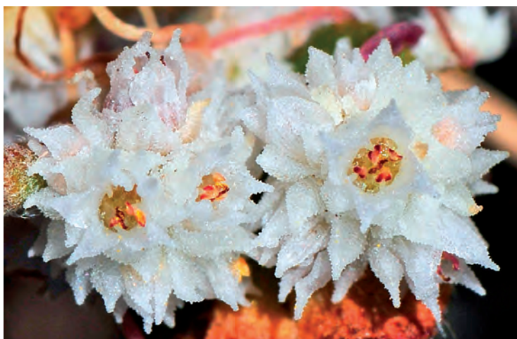
Fig. 11. Cuscuta nivea .

Anthos (2015); BDBCv (2015); Blanca, G. (2011); García García, M. A. (2001); García García, M. A. (2012); García García, M. A. y S. Castroviejo (2003); López Sáez, J. A. y cols. (2002); Mateo, G. y cols. (2008); Mateo, G. y M. B. Crespo (2009); Yuncker, T. G. (1932).