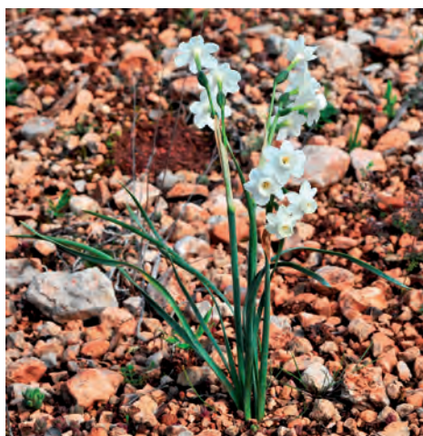
Fig. 16. Narcissus dubius.