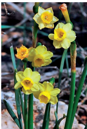
Fig. 17. Narcissus dubius de flor amarilla o N. × pujolii .