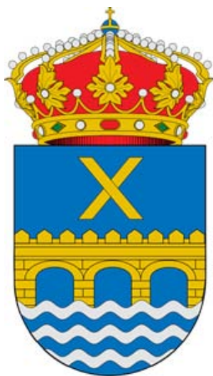
Escudo de Alcalá del Júcar

Por tal motivo el Ayuntamiento de Alcalá del Júcar ha solicitado la colaboración del Instituto de Estudios Albacetenses para conmemorar esta efeméride.