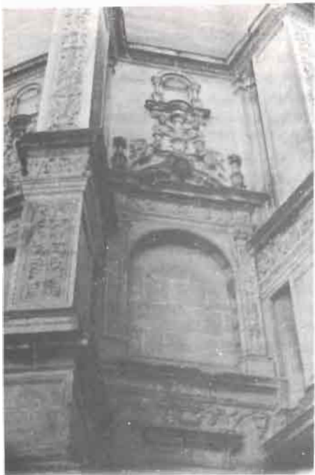
Fig. 6.- Santa María de Chinchilla. Segundo templete ciego exterior (lado epístola)