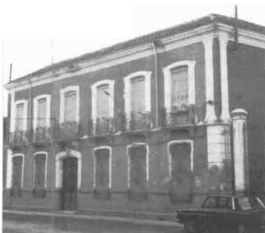
Foto 2.- Casa particular de Madrigueras, convertida en Cuartel General de las Brigadas Internacionales.

Battalion” o “Saklatvala”, encuadrado en la XV Brigada Internacional. Un sábado vino un hombre en motocicleta desde Albacete y habló con el comandante del batallón. Poco después, todos los voluntarios éramos congregados en la plaza de Madrigueras, en la plaza donde estaba la fuente del agua. Allí nos habló el comandante, diciéndonos que teníamos que ir al frente, pues un ejército de moros e italianos pretendía cortar la carretera de Madrid a Valencia. Antes de salir para el frente, el comandante se dirigió otra vez a nosotros. Había dos intérpretes. Por un lado, uno local, de Madrigueras, y por otro, uno que hablaba francés, repitiendo cada uno en su lengua las palabras en inglés del comandante. En esencia,