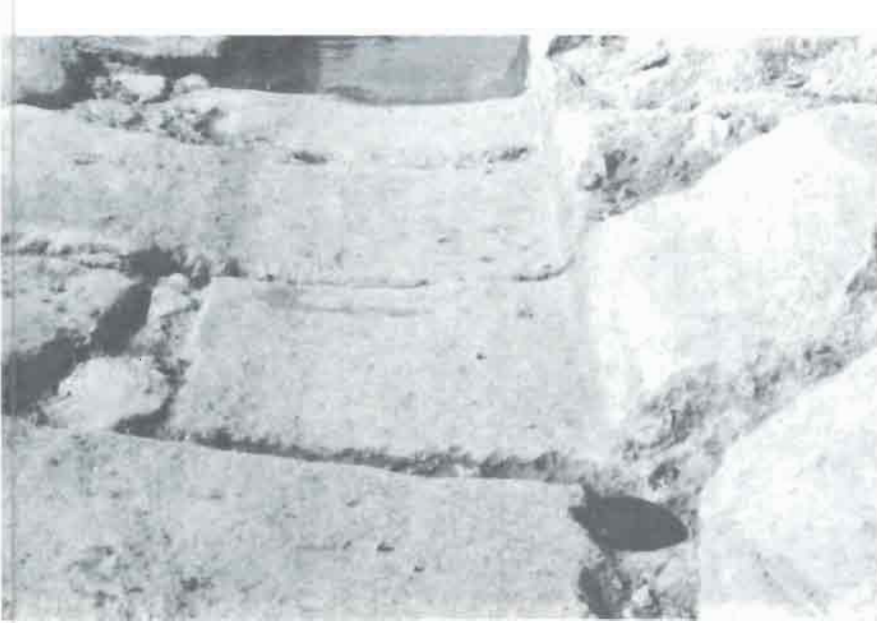
Puente número 1.- Detalle de la calzada romana en un lateral. La tapa del objetivo de la máquina fotográfica mide unos 5 cms.