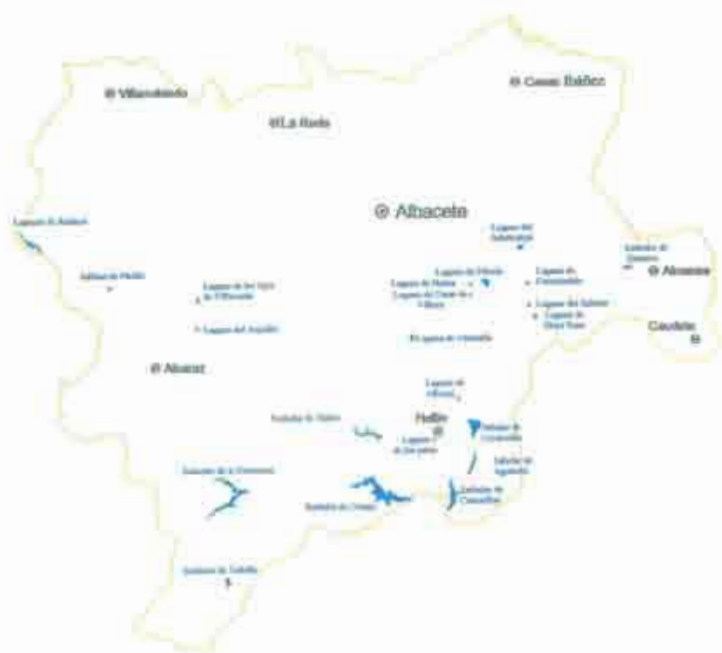
Figura 1. Mapa de la provincia de Albacete donde figura la localización de los lugares muestreados.