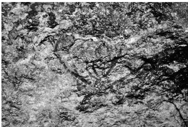
Fig. 3. Motivo 1. Ciervo

La actitud de esta figura nos recuerda mucho a la mostrada por otros cérvidos pintados en este núcleo del Alto Segura, entre otros, en la Cañaica del Calar II (Mateo Saura, 2007) o en Ciervos Negros (Mateo y Sicilia, 2010). Mide 18 cm de longitud. Color rojo (figuras 3 y 4).